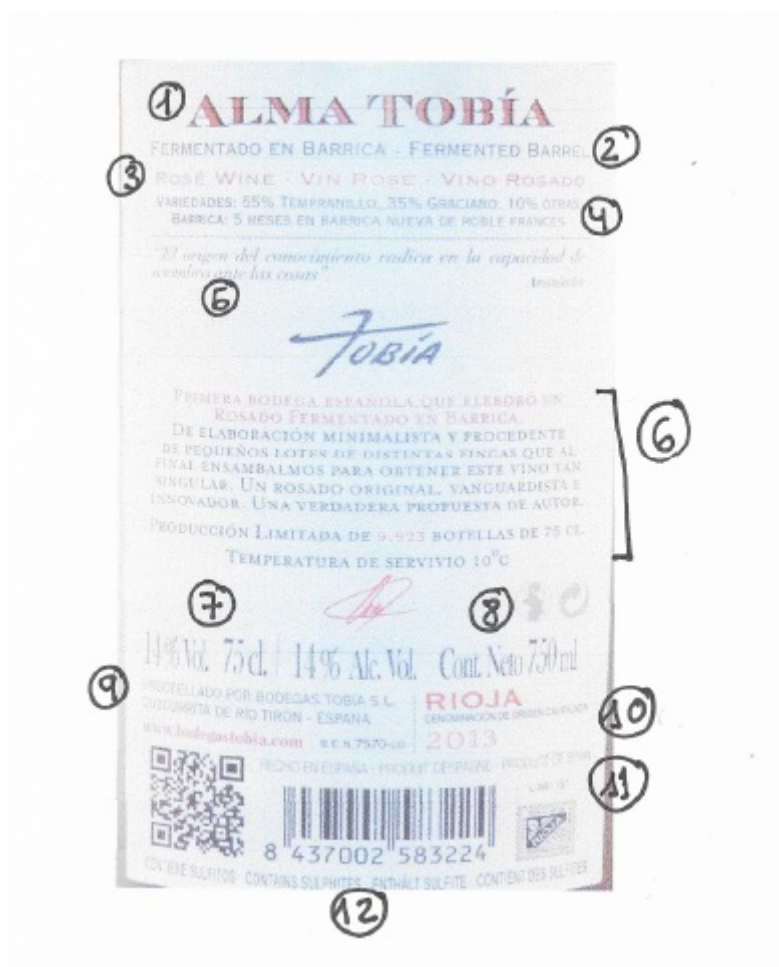
Imagen 6: Contraetiqueta vino en español.

como g.U.), motivos por el cual ya no es necesario indicar explícitamente que se trata de un vino con DOP. En el Número 11 se indica la procedencia del producto Producto de España (Erzeugnis aus Spanien) . Por último, en el Número 12 se informa de la presencia de un alérgeno, más concretamente de sulfitos, Contiene Sulfitos (Enthält Sulfite) , el cual se ha destacado mediante el uso de la mayúscula.