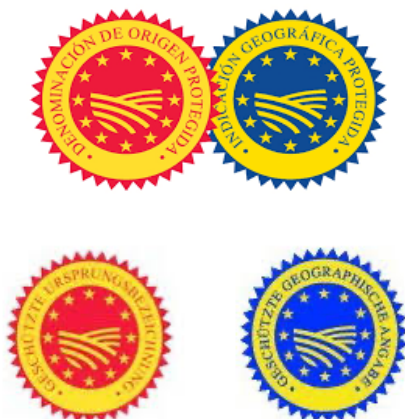
Imagen 1: Logos DOP e IGP en español y alemán

tanto los propios de Alemania como los propios de España, así como quedarían estos una vez traducidos. Dichos datos también están disponibles para su consulta en E-Bacchus. Por último, es importante destacar que en el caso de Alemania no existe ningún tipo de vino o término tradicional exento de indicar que se trata de una IGP o DOP, pero en el caso de España los vinos Cava, Jerez, Xérès o Sherry y Manzanilla no tienen la obligación de indicar que se trata de vinos con DOP. Por este motivo, como traductores si nos enfrentamos a problemas de espacio tenemos la licencia legal de, si estamos traduciendo el etiquetado de algunos de los vinos anteriormente mencionados, eliminar la mención a la indicación geográfica.