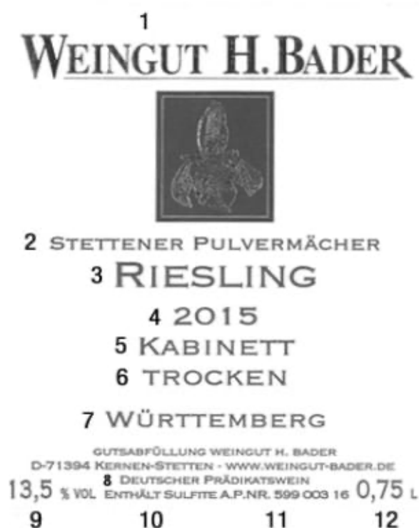
Imagen 5. Etiqueta de vino en lengua alemana.

Una vez que ya hemos analizado el marco legal al que está sujeto el etiquetado del vino dentro de la UE y hemos examinado los elementos que deben aparecer de manera obligatoria y facultativa en este apartado procedemos a analizar todas las indicaciones que podemos encontrar en etiquetas de vino reales. Para ello cogeremos como ejemplo etiquetas de vino originales tanto en español como en alemán. A continuación, comenzaremos con la etiqueta en lengua alemana que podemos observar en la Imagen 5.