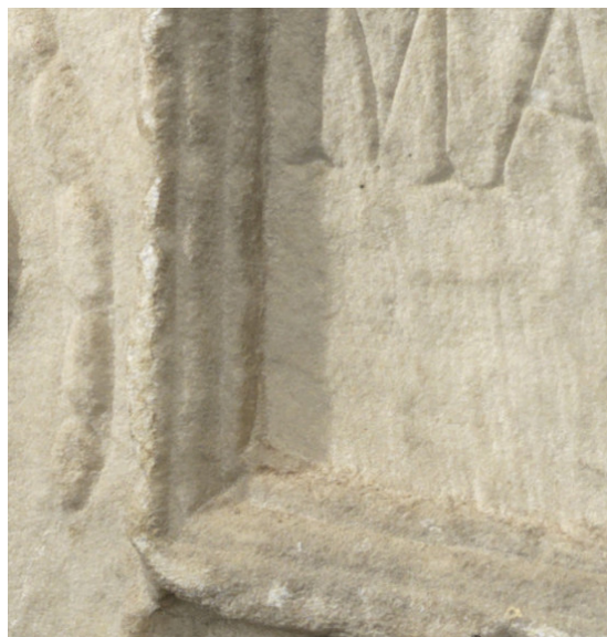
Fig. 5 - Particolare della tabula; si noti la modanatura più interna della cornice, probabile residuo dell'originale specchio epigrafico ribassato.

La compresenza di omphaloi su tripodi e grifi sulle urne cinerarie è ampiamente documentata (Sinn, 1987, n. 154, 164, 259, 260, 271, 412, 413, 550); la presenza della creatura alata su un monumento funebre si può prestare a differenti interpretazioni, nel grifone può essere scorto lo psicopompo addetto a trasportare l'anima del defunto nell'aldilà, secondo una tradizione originaria del Mediterraneo orientale ancora viva in epoca romana (Flagge, 1975: 34-43). In questo caso però la presenza del tripode con l' omphalos , richiamando un contesto delfico sottolinea il legame che le creature alate avevano con il dio Apollo. In alcuni casi sui rilievi delle urne urbane della seconda metà del primo secolo d.C. il legame tra le creature e il dio è rafforzato dalla presenza di strumenti musicali, un esempio pressoché coevo al nostro si può scorgere in un'urna conservata ai musei vaticani, dove ai tripodi con omphaloi in posizione angolare fanno compagnia due grifoni tra i quali sta una cetra