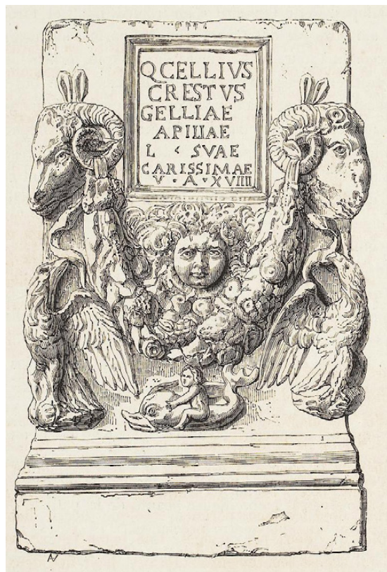
Fig. 8 - Disegno dell'urna dal catalogo della collezione Fould, Chabouillet 1861, p. 33.

spazio disponibile nella parte superiore della lunetta appiattendosi in linee incise più leggere nelle ciocche che rasentano la ghirlanda. Il volto è carnoso, ben rotondo e dalle gote gonfie, leggere occhiaie sottendono agli occhi sormontati da un'arcata sopraccigliare contratta in un'espressione torva. Il muscolo corrugatore del sopracciglio, così pronunciato, proietta un'ombra sulla palpebra superiore resa con morbidi e carnosi passaggi di piano la quale tange la parte superiore dell'iride, reso indistintamente dalla pupilla con un foro largo e poco profondo. La fortunata e vivace resa della parte oculare è ancor più evidente