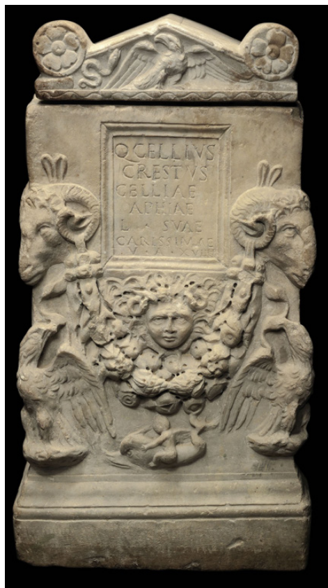
Fig. 6 - L'altare cinerario di Gellia Aphia corredato di coperchio nel catalogo elettronico dell'asta del 30 Novembre 2016.

Cat. 3 - L'ultimo dei tre oggetti è un cinerario in forma di altare, dalla forma