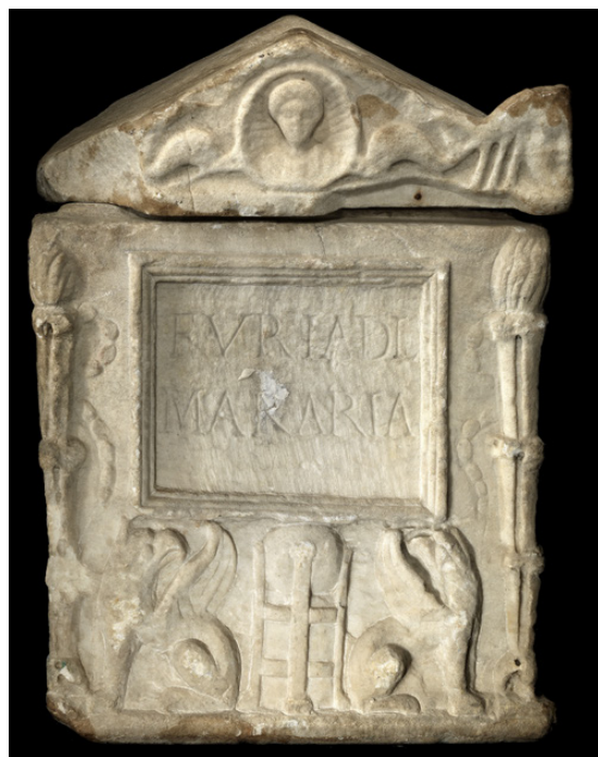
Fig. 4 - L'urna con il coperchio del quale è attualmente corredata.

modo di osservare l'urna a Roma, presso il laboratorio dello scultore Orfeo Boselli, l'iscrizione fu apposta in età moderna sul supporto antico. L'urna si trovava in Inghilterra già nel primo decennio del XVIII secolo (Wren, 1708: tav. VI, n. 5) 6 , ma rimane arduo stabilire quale tortuosa strada l'abbia condotta sino a Lowther Castle. È certo che l'urna sia giunta in Gran Bretagna dopo aver attraversato l'Europa continentale facendo almeno una tappa in Olanda, dove nella seconda metà del XVII secolo fu vista dal Papenbroeck, in