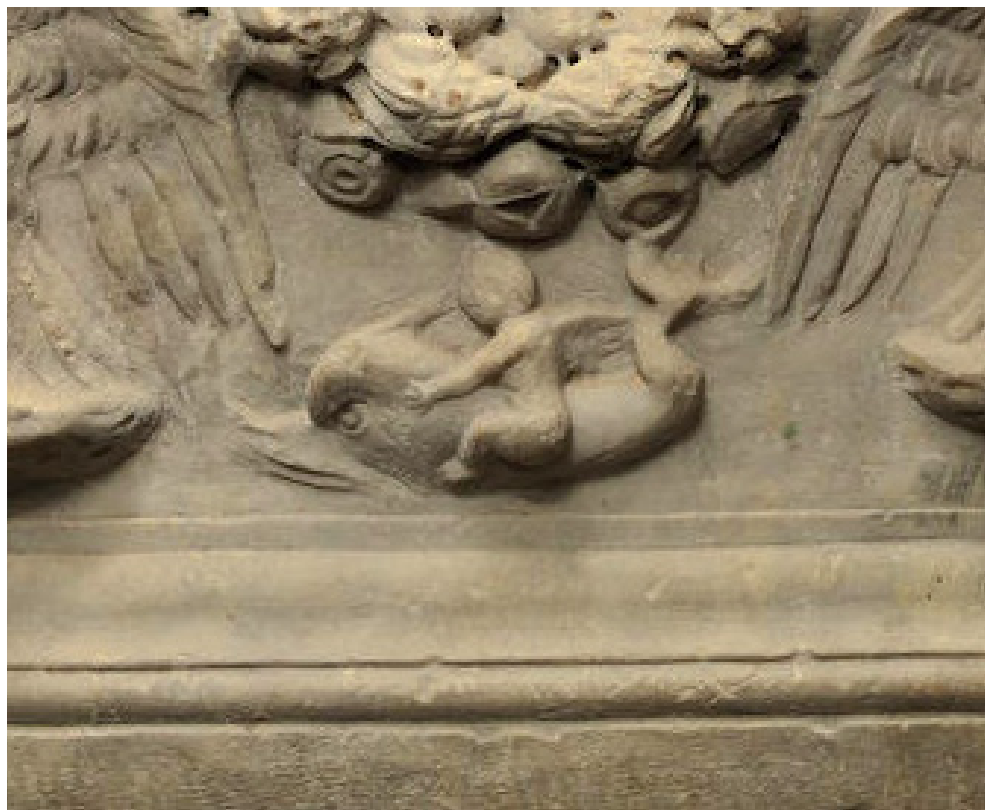
Fig. 9 - Dettaglio del rilievo dell'erote che cavalca il delfino, è evidente come la resa del volto sia appena accennata.

non chiara interpretazione, esso è già presente in ambito greco, ad esempio si veda la lekythos funeraria a figure rosse del secondo quarto del V secolo a C. opera del Pittore di Bowdoin conservata in una collezione privata negli Stati Uniti, (Ridgway, 1970: 93); in epoca romana il motivo sembra avere diversi sviluppi e valenze non solo legate strettamente alla simbologia funeraria ma anche prettamente decorative. Sui sarcofagi infantili del II secolo d.C. la presenza del delfino montato da un erote allude al trasporto verso un'esistenza ultramondana, felice rappresentata metaforicamente dal richiamo all'ambiente marino