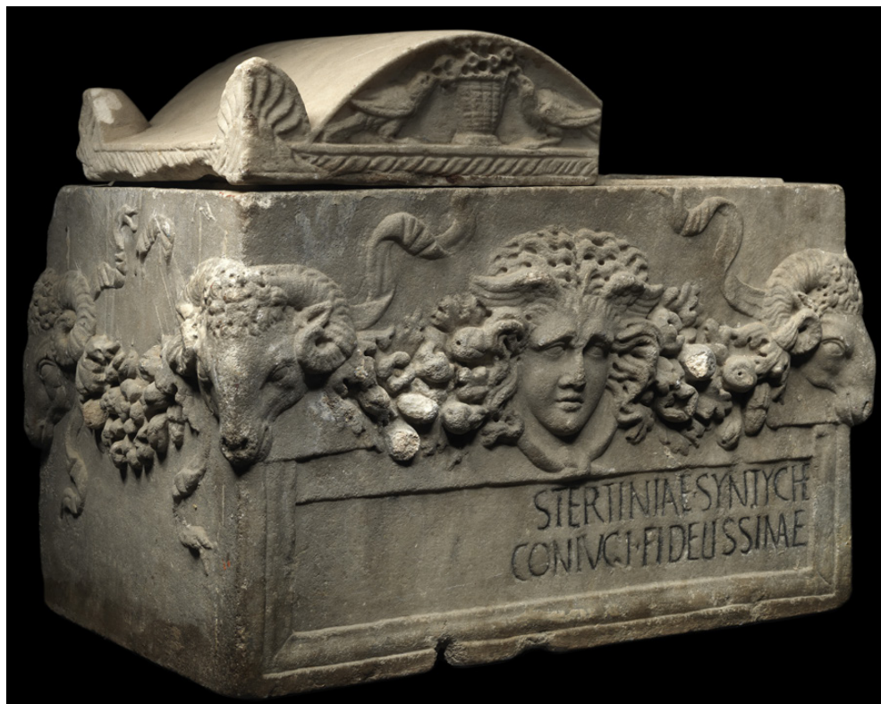
Fig. 2 - L'urna come si presentava all'epoca della sua permanenza a Lowther Castle.

nel 1763 pubblicò un'opera nella quale, tra l'altro, riportò le iscrizioni di provenienza urbana e suburbana conservate nella collezione di suo zio il cardinale Domenico Passionei presso l'eremo camaldolese tuscolano. È dunque possibile individuare la più antica collocazione nota dell'oggetto all'eremo nei