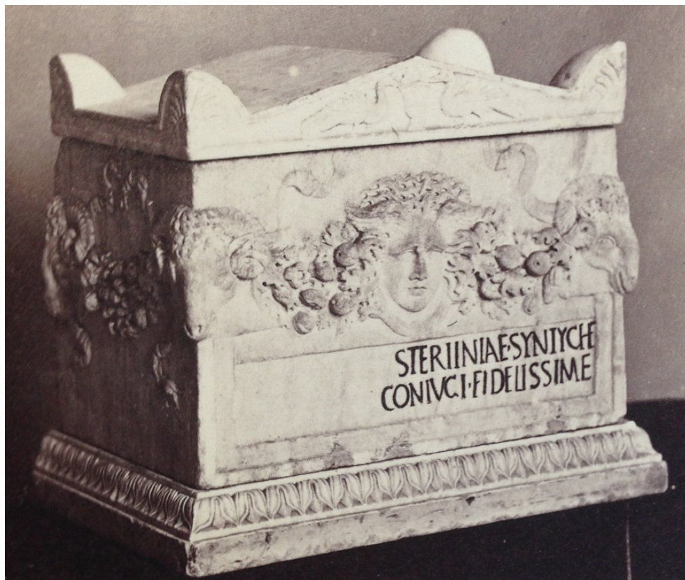
Fig. 1 - L'urna di Stertina Syntyche con il coperchio non pertinente del quale è attualmente corredata.

le collezioni all'interno delle quali sono stati conservati i cinerari in questione la letteratura su di essi è pressoché inesistente.