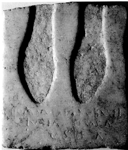
Fig. 5. Bub.lat.6. Lastra di Bubastis da Italica. Sevilla, Museo Arqueologico (da ALVAR, 2012, 63).

ne isiaca rinvenuta a Scarbantia c'è una dedica ad una divinità Augusta , in questo caso Iside e in quel caso Osiride; questo aspetto presente in entrambe le iscrizioni deve essere probabilmente ricondotto all'ambito ufficiale, forse militare, vista la massiccia presenza di soldati lungo il limes danubiano. È stato già messo in evidenza (PERRISIN-FABERT, 2004, 449-453) come il culto di Iside e Serapide sia stato praticato dai militari 7 . Non stupirebbe quindi che il Pomponius Severus , del quale Philinus era liberto, fosse un membro dell'esercito e che quindi il dedicante avesse acquisito da lui tale culto. È pur vero che lo stesso Philinus , che in considerazione dello