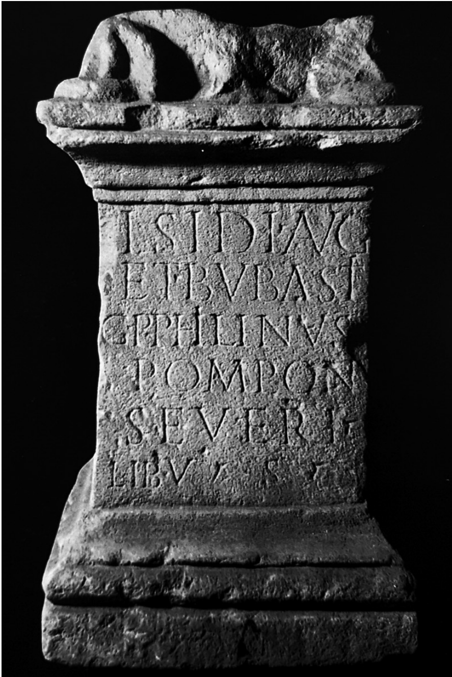
Fig. 4. Bub.lat.5. Ara di Bubastis da Scarbantia. Liszt, Ferenc Museum (da CLERC, 1997).