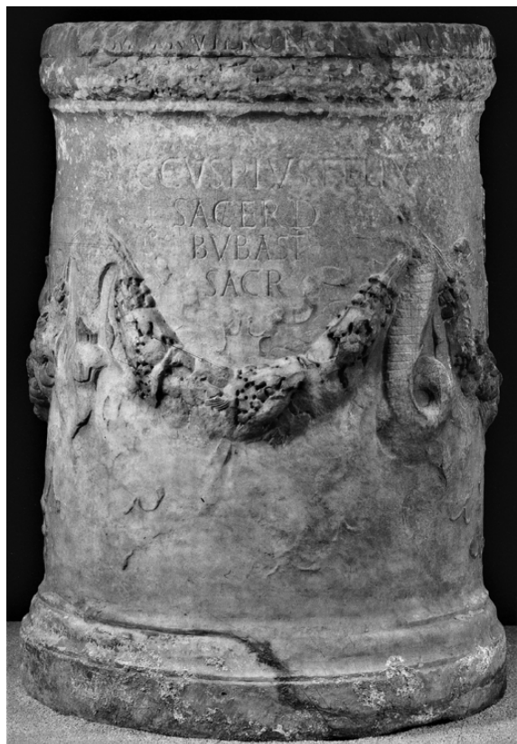
Fig. 2. Bub.lat.4. Ara di Bubastis da Turrus Libisonis. Porto Torres, Antiquarium turritano (da MANCONI, 1986, 280).

M(arco) Sevilio Noniano C(aio) Cestio (Gallo) co(n)s(ulibus) (vacat)