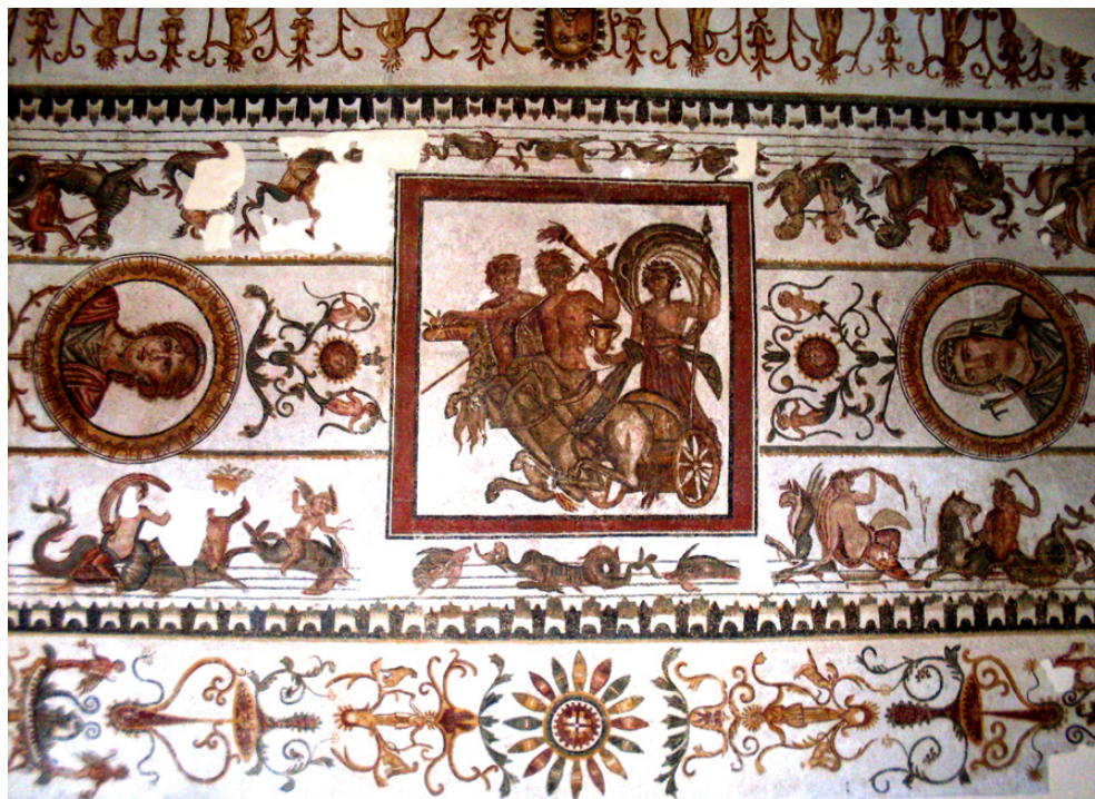
Fig. 5. Mosaico del triunfo de Dioniso de las Termas de Acholla.

determinando como resultado, en lugar de triángulos, ocho deltoides convexos como los documentados en un mosaico de Bignor (Rayney, 1973: 106, fig. 10b; Balmelle et alii , 2002: pl. 381b), que presenta una composición similar, pero basada en un octógono no dispuesto sobre la punta.