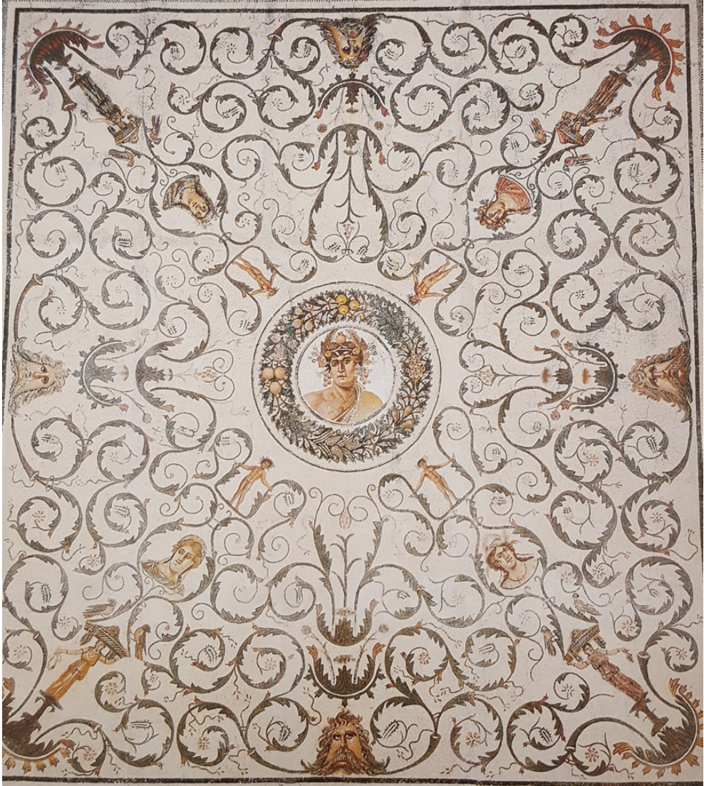
Fig. 7. Mosaico de Anus y las Cuatro Estaciones de Thysdrus que se conserva en el Museo de El Djem.

XXXIV, III; Clarke, 1979: 62) e Iguvium , fechado en el siglo IV d.C. (Stefani, 1942: 372-373) y en el polícromo de Oriculum , entre el 115 d.C. y años siguientes (Guattani,