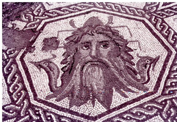
Fig. 2. Mosaico de Océano hallado en Ronda de Tejares 13 (Córdoba). Detalle de la máscara de Océano.

A pesar de que en el estado actual no hemos podido contemplar el mosaico 10 , las fotografías de su descubrimiento muestran algunas lagunas en el pavimento ( Fig. 1 ), si bien es apreciable entre las orlas de enmarque que bordean el campo una banda en la zona superior de círculos tangentes trazados en oposición de colores, similar a la composición documentada por Balmelle et alii (Balmelle et alii , 1985: pl. 231b), y una línea, en los otros tres lados, de teselas negras ondulante que atraviesa otro filete recto, similar a la sinusoide disimétricamente hinchada con efecto de cinta ondulada (Balmelle et alii , 1985: pl. 65b; Blake, 1940: pl. 13, 1-2). A continuación, hacia el interior, una cenefa de espinas cortas (Balmelle et alii , 1985, pl. 12, d) y una trenza de dos cabos polícroma sobre teselas negras sirven de marco unitario a todo el recuadro, en el que, con cráteras de las que surgen roleos con volutas en los ángulos, se inscribe un gran octógono, en cuyo centro se inscribe a su vez otro octógono decorado con la máscara de Océano ( Fig. 2 ), flanqueado según una disposición radial por figuras geométricas, alternando 8 cuadriláteros, en concreto deltoides convexos, y 8