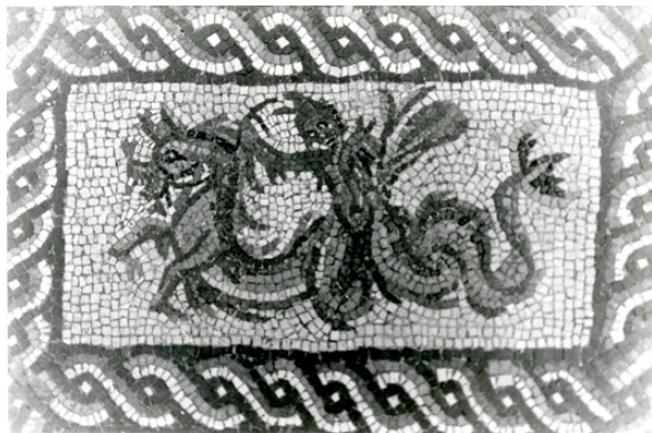
Fig. 8. Mosaico de Océano hallado en Ronda de Tejares 13 (Córdoba). Detalle del tritón.