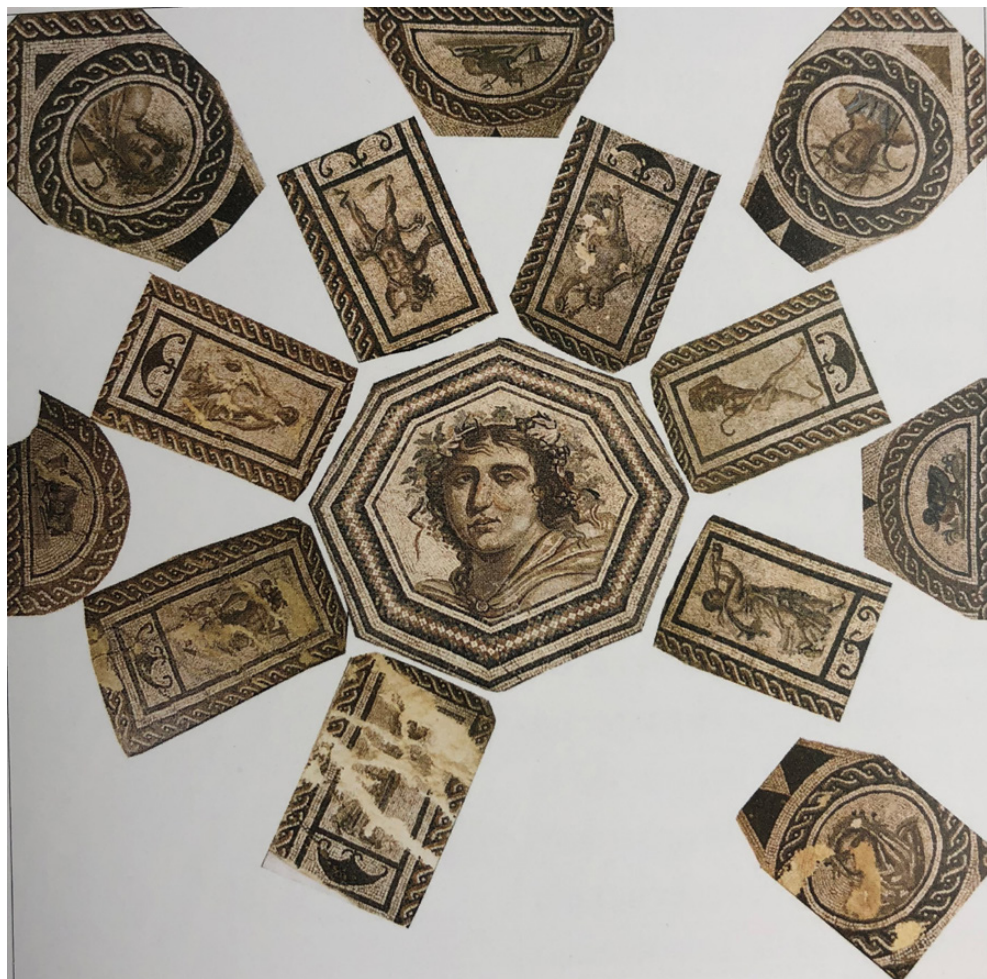
Fig. 3. Mosaico del busto de Dioniso. Extramuros área septentrional. Reconstitución de G. López Monteagudo. Foto: Según Arte Romano de la Bética III. Mosaico. Pintura. Manufacturas. Madrid: El Viso, 2010, fig. 58.

muros (Blázquez, 1981: núm. 12, láms. 13-16, fig. 13), que fueron restaurados y trasladados al Palacete de la familia Cruz Conde en la calle de Torres Cabrera (Moreno, 1996: E-2-5-E-2-9bis) y entre cuyos fragmentos fechados entre finales del siglo II y principios del III, se cuenta el busto de Dioniso ( Fig. 3 ), y uno de los mosaicos de la villa de Alco-