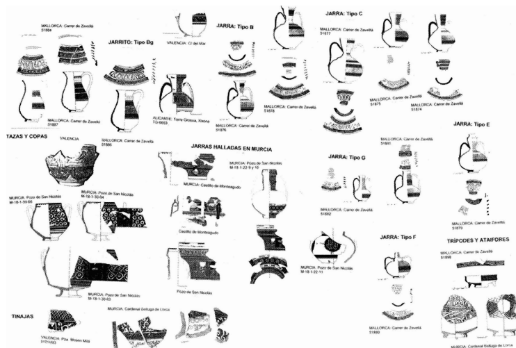
Lámina 4. Formas: Varias

resto de la superficie sin decorar como se observa en la jarrita valenciana de la C/ del Mar ( Lam II: Jarritas I: Tipo Bg ) y en la jarra del Pozo de San Nicolás ( Lam IV: Jarras halladas en Murcia: M-18-1-22-11 ). Otras veces el fondo se decora como en la jarrita TG-6654 de Torre Grossa en Xixona ( Lam III: Jarritas II: Tipo Be: Alicante ) o las piezas murcianas con representación figurada procedentes de Murcia, Cieza o Lorca ( Lam V ).