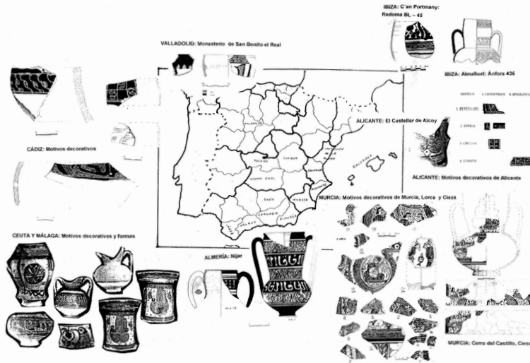
Lámina 5. Otros hallazgos y motivos decorativos.

Como se observa la cerámica esgrafiada es un grupo muy particular, sobre el que sabemos con cierta seguridad su adscripción cultural, su cronología, su dispersión geográfica, sus formas y sus motivos decorativos, pero respecto a su función solo hay hipótesis por confirmar.