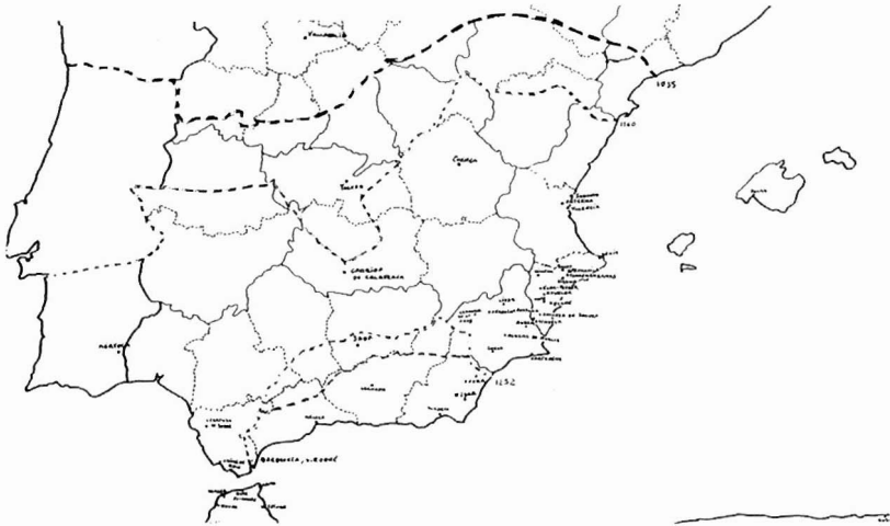
Lámina 1. Mapa de distribución de la cerámica esgrafiada.

trando la mayor variedad y concentración en Murcia (Murcia capital, Lorca, Cieza...), Alicante (Xixona, Denia, Alcoy...) y Mallorca. En la costa norteafricana aparece desde Sale a Bugia, pasando por localidades como Lixus, Tanger, Ceuta y Tetuán.