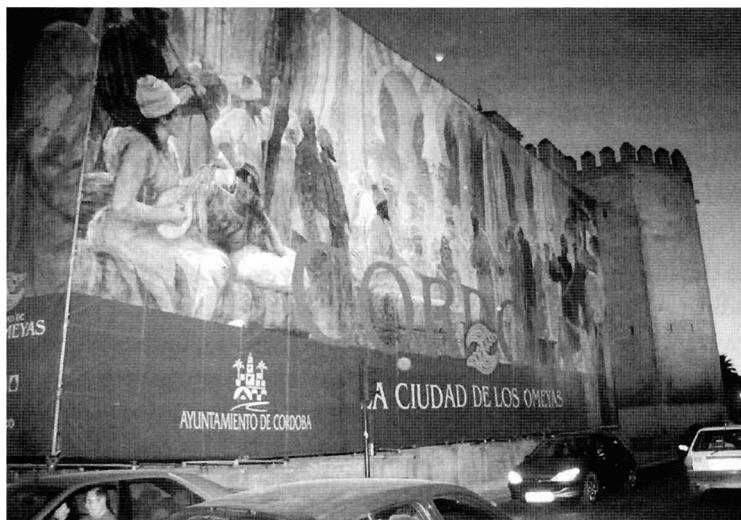
Figura 4. Publicidad de La ciudad de los Omeyas en el Alcázar de los Reyes Cristianos de Córdoba.

Iniciativas públicas y privadas 32 también se han unido con motivo de esta sonada exposición, todo un acontecimiento de trascendencia internacional que vino a instalarse en