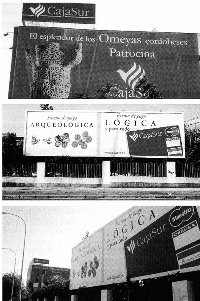
Fig. 5. Publicidad contradictoria.

Desde su atalaya califal, la consejera de Cultura de la Junta de Andalucía ha sabido compaginar el impulso de la muestra y su imagen política de una forma extraordinaria. Con palabras tan conmovedoras como las siguientes: “Esta exposición es un canto a la solidaridad en un tiempo en que la convivencia en paz sigue siendo un bien frágil y escaso” 36 consiguió dotar a “Los Omeyas” de otra serie de valores relacionados con asuntos políticos actuales.