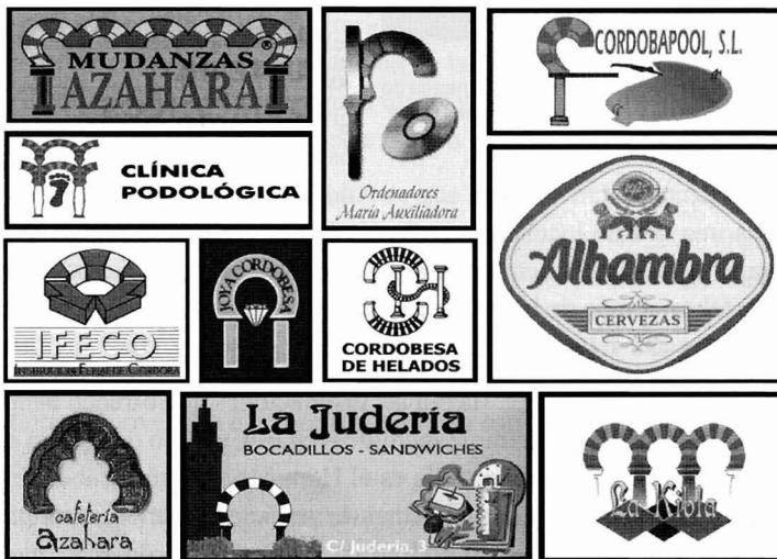
Figura 2. Iconos islámicos en logotipos de empresas. Composición: Juan de Dios Borrego.

Que las agencias de viajes se publiciten por medio del patrimonio islámico no es algo descabellado, al fin y al cabo lo incluyen entre sus ofertas. Lo sorprendente es que las