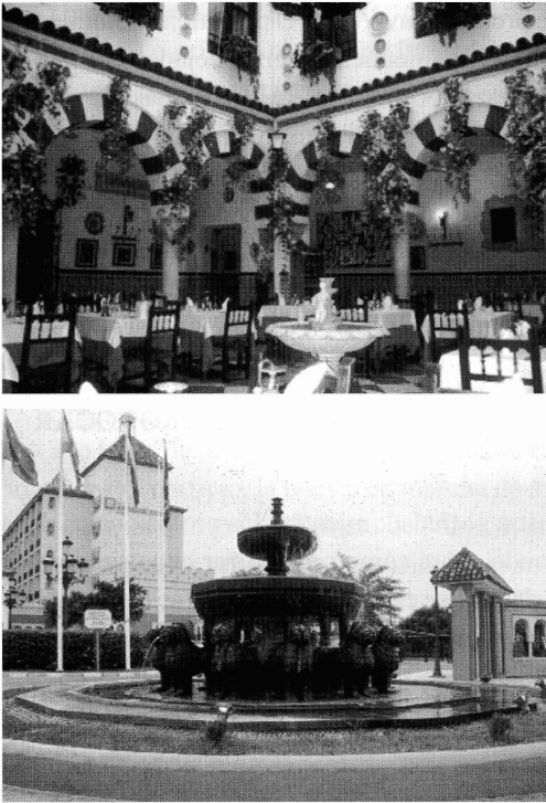
Figura 3. Restaurante de la Judería de Córdoba. Entrada de un hotel en las afueras de Sevilla.

heladerías utilicen esa misma imagen, del mismo modo en que lo hacen clínicas podológicas, academias de estética, carpinterías, empresas de mudanzas, ascensores, ordenadores, azulejos, plásticos y toda una serie de comercios cuyos productos nada tienen que ver con los logotipos que le sirven de carta de presentación 20 (Fig.2). Hasta la Universidad de Córdoba ha escogido las dovelas blancas y rojas para darse a conocer, e incluso un detalle del mihrab de la Mezquita ha servido de imagen a tres ediciones de unas Jornadas de Arqueología Cordobesa donde la fase islámica apenas tuvo presencia, a diferencia de las que han servido de marco a esta publicación.