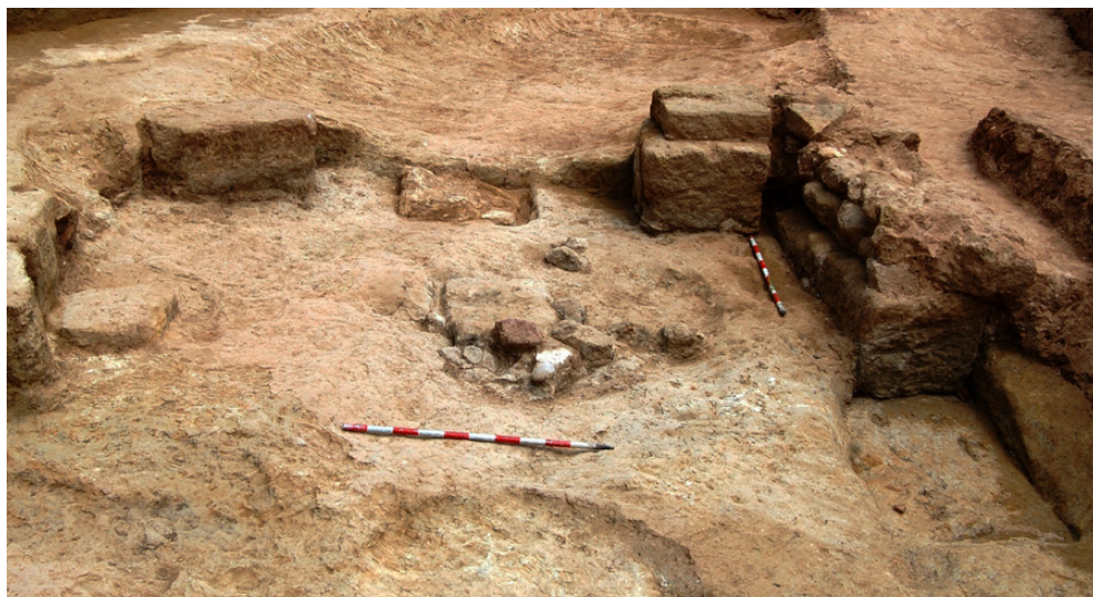
Fig. 12. Pilares hallados en la Dependencia 5, asociados con una posible estructura con suelo sobreelevado.