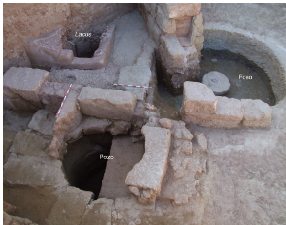
Fig. 6. Vista del área productiva.

La pieza central de la estructura circular podría indicar una función destinada a la molienda, en el que ese elemento actuaría de