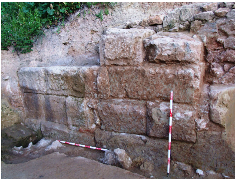
Fig. 4. Muro que delimita al sur el área productiva.