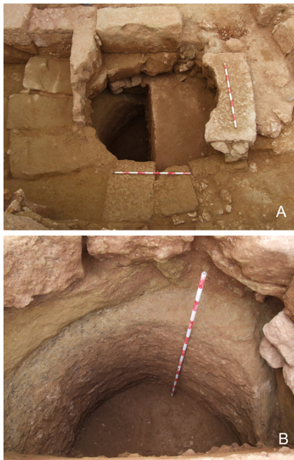
Fig. 9. Pozo en la Dependencia 4 (A) y vista del interior (B).

este contenedor, la estancia presentaba un suelo compactado a base de arena, ripios y almagra.