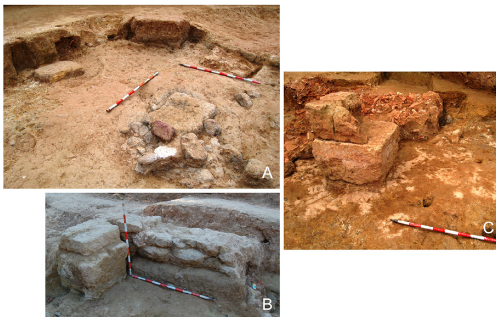
Fig. 13. Detalle de la Dependencia 5: Pilares situados al este (A); pilar junto al probable muro de cierre meridional (B) y pilar noroccidental, que presenta doble altura (C).