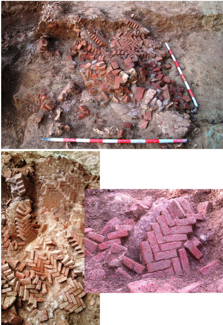
Fig. 8. Colmatación con restos de pavimento de opus spicatum sobre cama de opus signinum.

Asociados con esta actividad de prensado se documentaron otras dos estructuras: un pozo y una pileta. Se ubicaban en la D4 y la D1 respectivamente. No podemos descartar que la D3 estuviera relacionada también