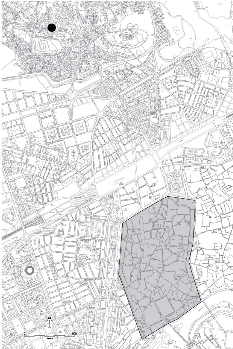
Fig. 1. Situación del terreno con respecto a la muralla de época romana.