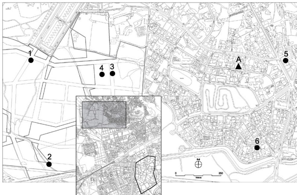
Fig. 2. Restos romanos hallados en el entorno. A: Asentamiento de la Arruzafa; 1-2: Depósitos hidráulicos; 3-4: Restos C/ La Laguna; 5: Alfar de El Tablero; 6: Villa C/ Poeta Miguel Hernández.

construcción, aunque se relacionó con los restos de la C/ La Laguna, dada su cercanía y su misma cronología romana republicana (Galera, 2011).