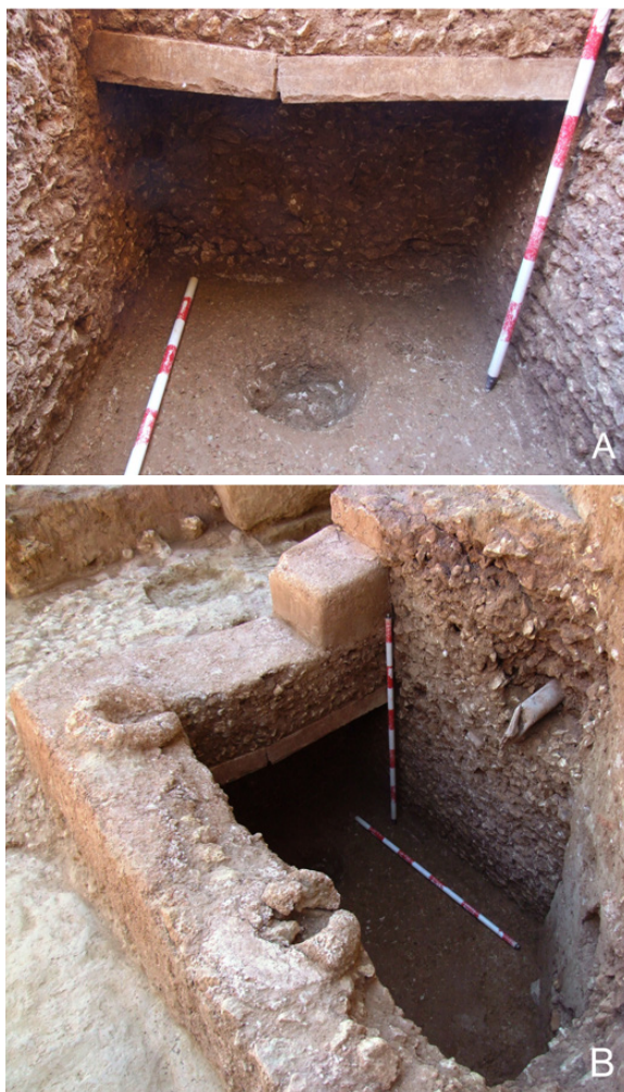
Fig. 11. Vista del interior (A) y elementos circulares de opus signinum sobre la pared del depósito (B).

Analizando los pocos datos con los que contamos, nos decantamos por plantear que se trataba de una construcción con el suelo dispuesto sobre pilares. El material recuperado en su nivel de abandono no aportó información con respecto a una funcionalidad concreta, aunque destacaba la presencia en su zona noroccidental de numerosos laterculi . El firme donde apoyaban los pilares era la roca natural, que poseía una superficie irregular, lo que llevaba a concluir que el nivel de suelo debería encontrarse más elevado y que, por tanto, no se conservó. Esta tipología de construcciones, con pavimento elevados sobre pilares, puede tener diversas funciones en el ámbito de un centro productivo como el que nos ocupa. Podría tratarse de un hipocausto, como presentan algunas de las almazaras documentadas en la zona lusitana, que se ubican junto a una fuente de calor auxiliar o de un conjunto termal. Según los autores clásicos, las almazaras debían situarse en un