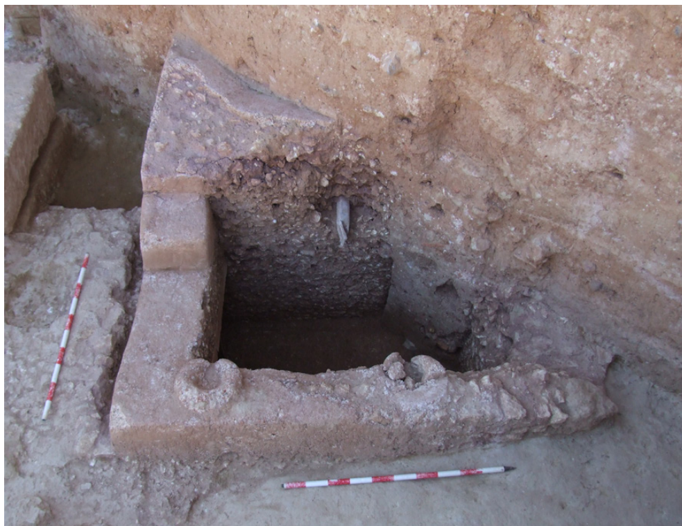
Fig. 10. Depósito hallado en la Dependencia 1, que se introduce bajo el perfil occidental del corte.

líquido trasvasado no sería el aceite, sino el que contiene mayoritariamente alpechín. La conexión entre las distintas cubetas se producía por la parte baja de las mismas, mediante tuberías de plomo. Varias son las razones que nos llevan a plantear esta asignación: por un lado, el hecho de que la estructura va ganando en altura hacia el oeste, donde se situaría la cubeta anterior a la que hemos documentado, ya que al estar conectadas por la parte baja las cubetas suelen estar distribuidas en niveles escalonados, con las últimas a una cota inferior 16 ; por otro lado, el descuidado