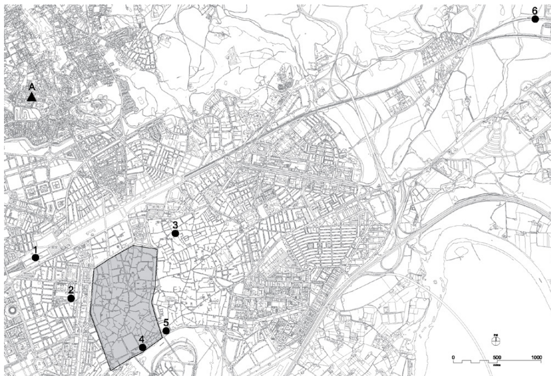
Fig. 5. Yacimientos relacionados con la producción oleícola en Córdoba. A: Asentamiento de la Arruzafa; 1: Villa de Cercadilla; 2: C/ Antonio Maura; 3: C/ Moriscos; 4: C/ Caño Quebrado; 5: Antigua Posada de la Herradura; 6: Villa de Rabanales.

llazgos relacionados con este tipo de asentamientos suburbanos excedería por mucho los límites de este trabajo 14 , no obstante, en las siguientes líneas vamos a realizar un sucinto repaso por las intervenciones arqueológicas en las que se han sacado a la luz restos de estructuras que podrían estar relacionadas con la producción oleícola ( Fig. 5 ).