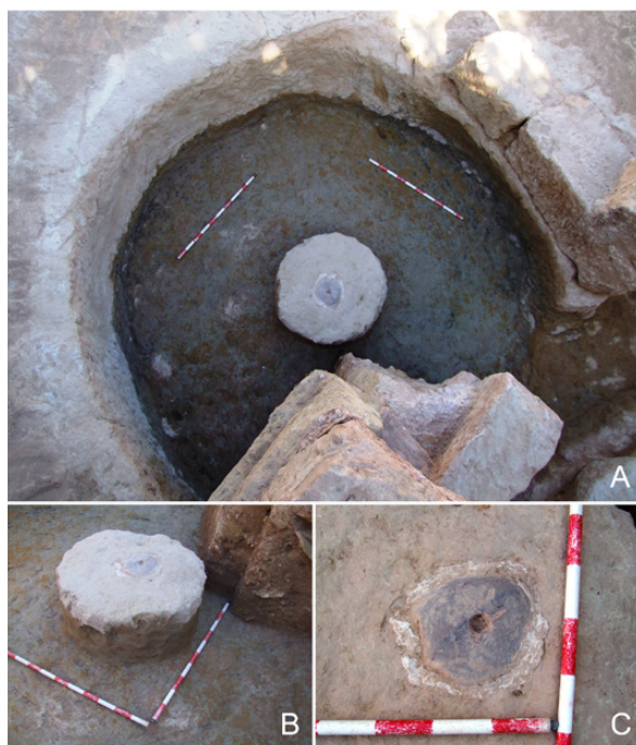
Fig. 7. Estructura en foso documentada en la Dependencia 2. Vista cenital (A), pieza central (B) y detalle del canto rodado perforado en su coronación (C).