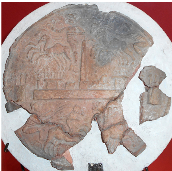
Fig. 2. Il medaglione fittile da Hadrumetum, ora al Museo del Bardo di Tunisi (foto A. Teatini).