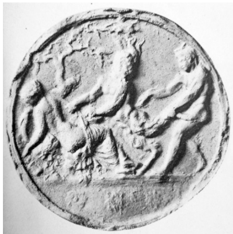
Fig. 4. Il positivo ottenuto dalla matrice per medaglione da Cherchel (da Waille, 1892: pl. XI).

(diametro cm 12,2) con la raffigurazione di un'affollata scena di corsa nel circo ( Fig. 7 ), caratterizzata da tutti i dettagli della spina utili a richiamare il Circo Massimo: compresi tra le metae si individuano agevolmente i delfini, la statua di Vittoria su una colonna, l'obelisco al centro e, dopo un'altra statua su colonna, Cibele sul leone. Sulla spina stessa si legge inoltre l'iscrizione hic munus hic circus , mentre anche gli spettatori sono sinteticamente rappresentati da schematiche teste ammassate nella cavea che cinge in alto la superficie. Le quadrighe delle quattro fazioni, trainate da cavalli, sono tutte relegate nel registro inferiore del medaglione: proprio tale dettaglio compositivo ha indotto l'editore del pezzo a riferirlo alla seconda metà del IV secolo (Glaser, 1978-1980: 119-120). Alcune