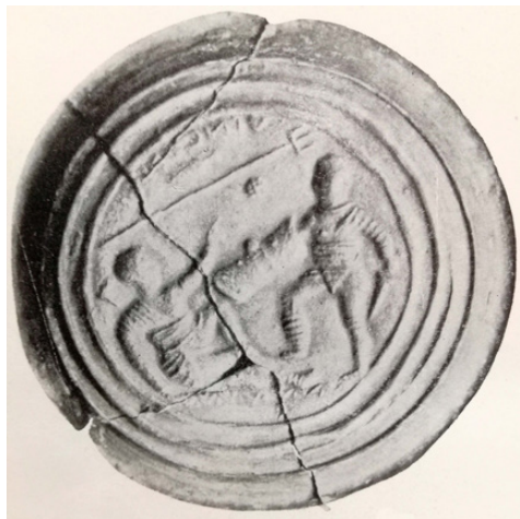
Fig. 6. Matrice per medaglione da Savaria (da Alföldi, 1938: tav. LXVIII, 2a).