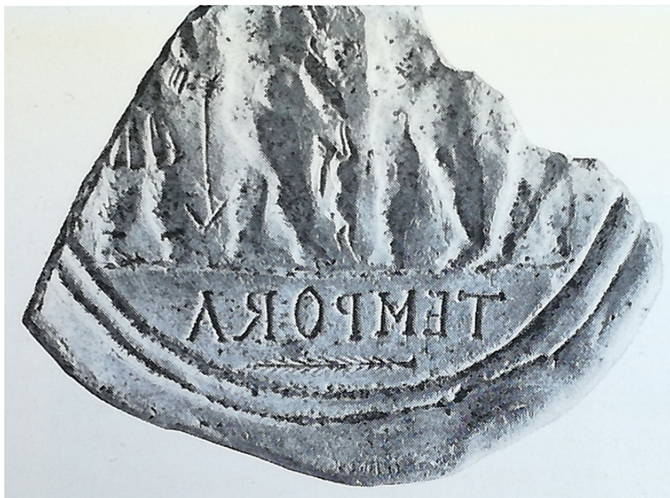
Fig. 5. Frammento di matrice per medaglione da Cartagine (da Salomonson, 1972: fig. 30a).

(diametro cm 12,2) con la raffigurazione di un'affollata scena di corsa nel circo ( Fig. 7 ), caratterizzata da tutti i dettagli della spina utili a richiamare il Circo Massimo: compresi tra le metae si individuano agevolmente i delfini, la statua di Vittoria su una colonna, l'obelisco al centro e, dopo un'altra statua su colonna, Cibele sul leone. Sulla spina stessa si legge inoltre l'iscrizione hic munus hic circus , mentre anche gli spettatori sono sinteticamente rappresentati da schematiche teste ammassate nella cavea che cinge in alto la superficie. Le quadrighe delle quattro fazioni, trainate da cavalli, sono tutte relegate nel registro inferiore del medaglione: proprio tale dettaglio compositivo ha indotto l'editore del pezzo a riferirlo alla seconda metà del IV secolo (Glaser, 1978-1980: 119-120). Alcune