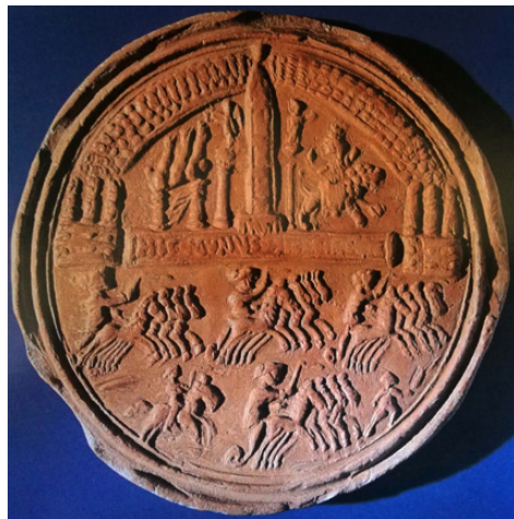
Fig. 7. Medaglione fittile da Teurnia (da Piccottini, 1989: tav. 45).

evidenti divergenze separano questo esemplare da quello di Hadrumetum , ove il tiro dei carri è costituito da coppie di dromedari e le quattro bighe sono scaglionate con regolarità attorno alla spina: purtuttavia questi due medaglioni sono gli unici con immagini di spettacoli circensi.