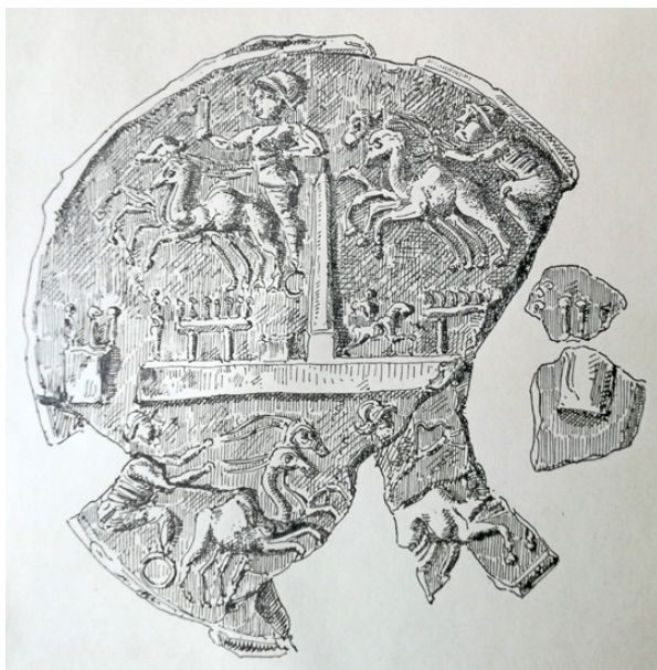
Fig. 3. Disegno del medaglione (da Lafaye, 1890: tav. VIII).