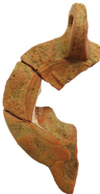
Fig. 3. Lucerna tipo Dr. 28 con posible representación de Helios/Saerapis.

Ejemplares de esta misma tipología de lucerna fueron recuperados en el Mirador I (Fernández Sotelo, 1994: 16-18; Bernal Casasola, 1995: 40). No es casual esta coincidencia en el tipo de lucernas halladas en el Mirador I y las que han sido documentadas en la calle Jáudenes. Ambos contextos