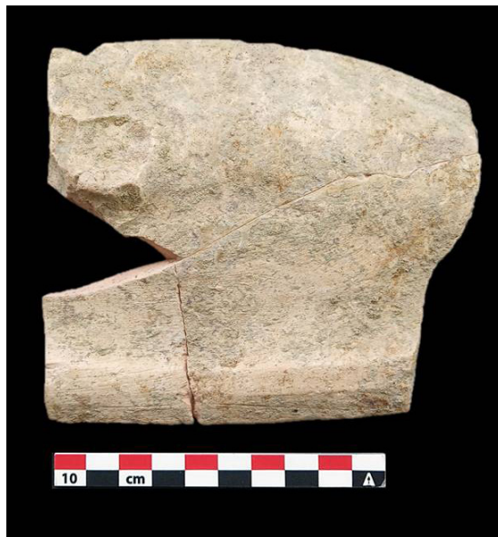
Fig. 7. Vista de la cara externa del molde.