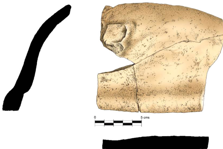
Fig. 5. Sección y dibujo de la parte externa del molde. Dibujo: Jesús Pérez Rivera.