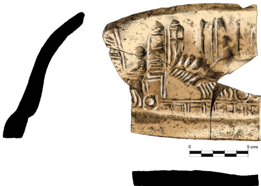
Fig. 4. Sección y dibujo de la parte interna del molde. Dibujo: Jesús Pérez Rivera.