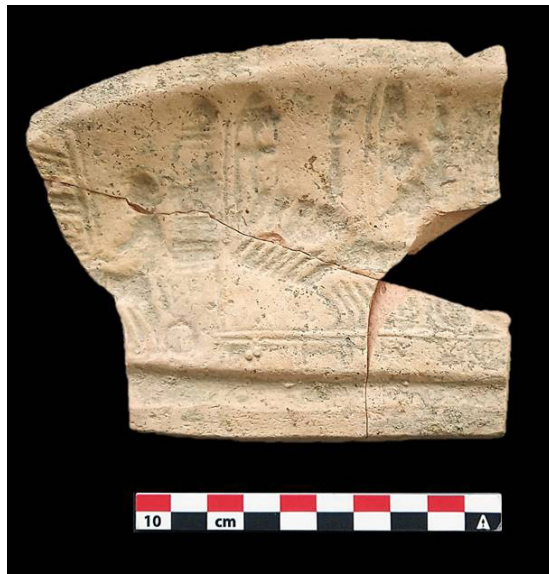
Fig. 6. Vista de la cara interna del molde.

La escena decorativa consiste en una escena de circo cuyos protagonistas son dos carros, que discurren por la pista circense. La parcial conservación de la pieza y el grado de deterioro de los motivos no permiten apreciar todos los detalles, pero sí tiene el suficiente relieve para identificar una cuadriga central tirada por cuatro caballos en posición de