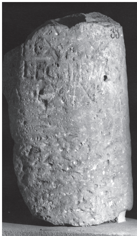
FIG. 2. Miliario de San Román de Castiliscar con referencia a la legio IIII Macedonica

de Castiliscar en esta ocasión con referencia a la legio IIII Macedonica ( IRMN , 1=Fig. 2: FATÁS y MARTÍN-BUENO 1977, 23 y 19; CASTILLO 1979, luego en CASTILLO, GÓMEZ-PANTOJA y MAULEÓN 1981, 18-21 y todos en LOSTAL 1992, 26-29, nºs 17-19 y 2009, 205, 210 y 213-214, nºs 3, 7 y 10), todos ellos fechados entre el 9 y el 3 a. C. Así, entre el 9 y el 8 a. C. habría que ubicar los alusivos a la legio X y a la legio IIII y entre el 5 y el 3 a. C. el referido a la legio VI. A este panorama, en 1982 se añadió el sensacional descubrimiento –acaso no dema-