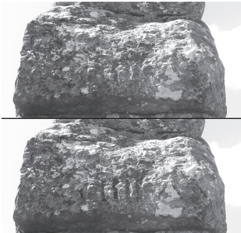
FIG. 4. Detalle de una de las marcas con la serie L(egio) IIII M(acedonica) en el tramo elevado del acueducto de Los Bañales

construcción de esta singular marca de romanidad que, en cualquier caso, tan sólo debió complementar un sistema de abastecimiento de agua que, verosímilmente, la ciudad prerromana hubo de tener solucionado de algún otro modo todavía pendiente de evidenciar arqueológicamente (JORDÁN 2011, 327 y 335 además de ANDREU 2011, 35-36). El ejército, además –como conocemos por algu-