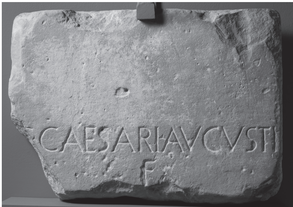
FIG. 6. Placa con dedicatoria a Cayo César procedente de Rivas, hoy en el Museo de Zaragoza

exhiben los elementos complementarios de la titulación consular o los cognomina honoríficos oportunos impiden extraer conclusiones respecto de si la honra es anterior o no a la proclamación como princeps iuuentutis del honrado, asunto habitualmente recordado en las fuentes antiguas (CASS. DIO 55, 9, 9 y OV. Ars. Am. , 1, 194 además de SUET. Aug. 64). Por todo ello, tal vez la propuesta más aceptable para su datación sea asumir una fecha de en torno al 5 a. C., que, por otra parte, es el momento en que parece deben fecharse la mayor parte de los testimonios hispanos de este tipo de tituli (ABASCAL 1996, 63 además de GALINSKY 2012, 133-137 y MORENO y QUIÑONES 2011, 16-22) y el de más eco en la documentación una