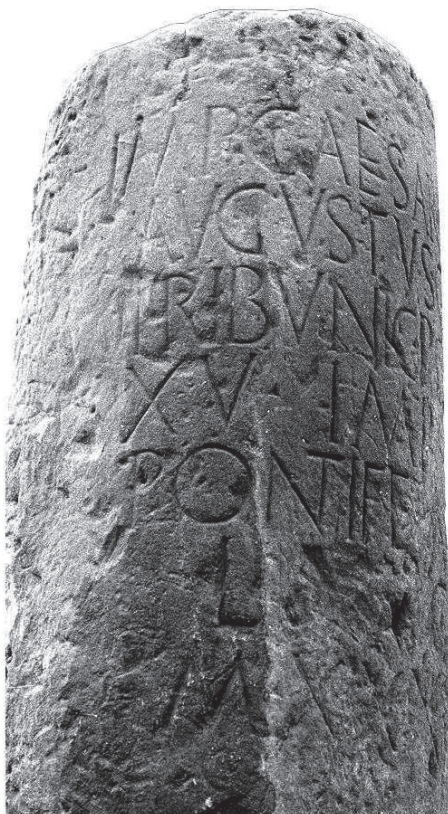
FIG. 1. Miliario del Barranco de Valdecarro, de Ejea de los Caballeros, con alusión a la legio X Gemina