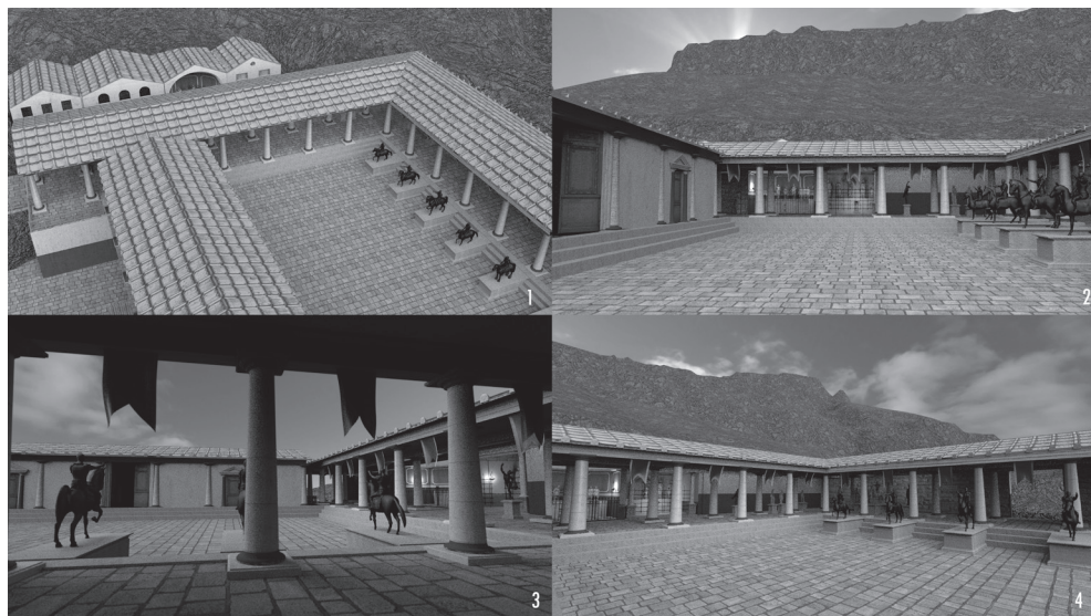
FIG. 5. Recreación infográfica –diversos detalles– del ángulo occidental del foro de la ciudad romana de Los Bañales (P. Serrano): 1. Vista cenital, 2. Vista de la plaza y del pórtico occidental desde el Este, 3. Vista del pórtico meridional, desde el Norte, 4. Vista del ángulo occidental desde el cierre meridional.

sobre dicha pieza se propondrán a propósito de la temprana integración de la zona que estudiamos– cobra ahora una muy especial importancia (BELTRÁN LLORIS, MARTÍN-BUENO y PINA 2000, 86 y ANDREU 2011, 37, n. 74) en el repertorio epigráfico de las Cinco Villas de Aragón –máxime en el marco de los últimos hallazgos escultóricos efectuados en la ciudad romana de Los Bañales– una monumental placa de arenisca dedicada a Cayo César y hoy conservada en el Museo de Zaragoza ( HEp 5, 916=Fig. 6). Empleada –a nuestro juicio, sin fundamento– como indicio de la existencia en Rivas, en el lugar en que fue localizada, de una ciuitas (GALVE, MAGALLÓN y NAVARRO 2005, 205) su presencia evidencia claramente de qué modo los primeros resortes del hábito epigráfico urbano en el conuentus Caesaraugustanus descansaron sobre la iniciativa oficial (JORDÁN