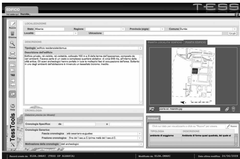
LÁM. 2: La finestra "edificio".

serimento dei dati e la loro analisi partendo dal generale al particolare, dall'esterno verso l'interno, vale a dire dall'edificio, all'ambiente, al rivestimento fino ad arrivare alla presentazione dettagliata dei modelli che compongono il tappeto musivo; questo sistema, basato su una organizzazione delle informazioni a più livelli, costituisce anche una innovazione della ricerca, poiché vengono messi in evidenza i contesti architettonici che contengono le decorazioni pavimentali (OMARI, 2009, 12-20).