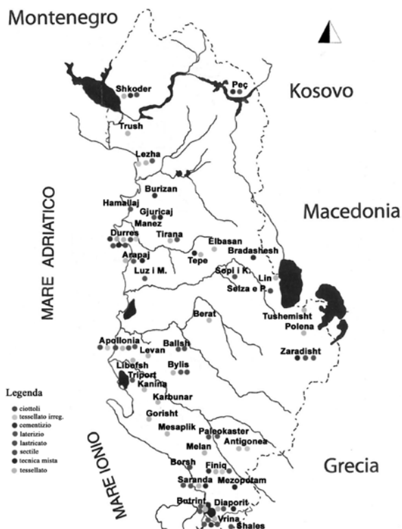
LÁM. 7: La pianta dell'Albania con i siti e le decorazioni pavimentali individuati.

Concludendo, quanto messo in luce finora non lascia dubbi sul gusto della committenza albanese, improntato a una notevole sobrietà e funzionalità: la scelta di coprire i pavimenti degli ambienti in edifici pubblici e/o privati con tessellato irregolare, lastricato,