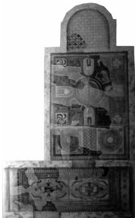
LÁM. 6: Disegno ricostruttivo del mosaico di Tirana, fine del IV sec.d.C..

da Durazzo, essi sono di manifattura eccellente; ciò fa dedurre che gli artigiani attivi in quest'area lo hanno già sperimentato e sono in grado di effettuare coperture con la nuova tecnica (HOTI, SHEHI e SANTORO, c. s.). In Albania il tessellato raggiungerà l'apice nel V-VI sec.d.C. quando l'area era governata da Imperatori autoctoni.