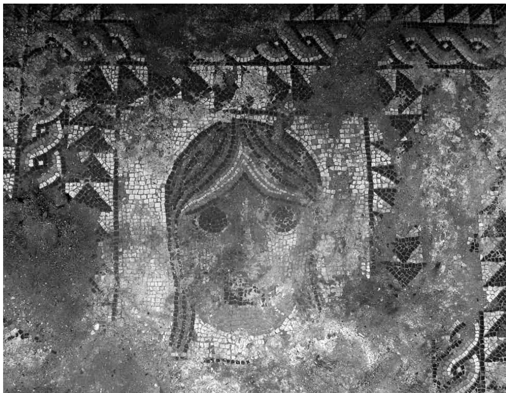
LÁM. 5: Parte del mosaico nella stanza XXIV della Triconca, Butrinto. Fine II-inizio III sec.d.C. (foto dell'autore).

te che ben soddisfacevano le esigenze delle classi sociali elevate. In effetti la grande varietà delle tecniche (a ciottoli, con tessere irregolari, lastricati, cementizi, commessi laterizi, sectilia, tecniche miste e tessellati) dimostra la vivacità produttiva, testimoniata in 43 siti e 265 rivestimenti, presenti in edifici pubblici e privati ( Lám. 4-6 ).