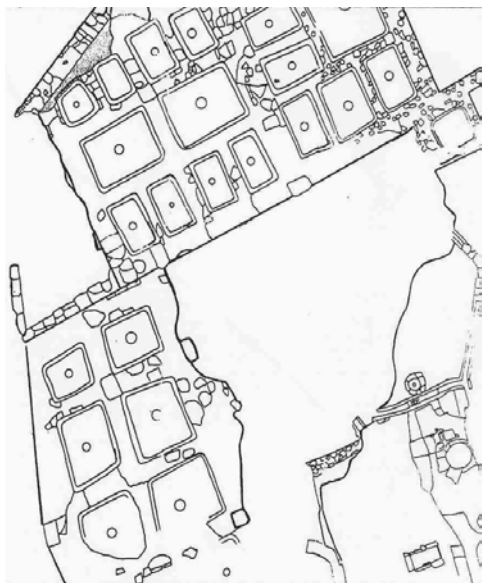
LÁMINA II. Planimetría del solar del Teatro de Andalucía/95. Necrópolis del siglo II a.C. y factoría de salazón del siglo I a.C. (Cobos, 1997).

tarté cuyo Templo se situaría en la Punta del Nao y que estuvo en funcionamiento hasta el siglo II a.C (DE FRUTOS Y MUÑOZ, 2004, 15). Si fue así podría considerarse que se produjo una desamortización del Templo y por lo tanto, de la sacralidad de la isla. Por otro lado, es posible que se produjese una importante reordenación del territorio en función de la explotación de recursos industriales. Así, LÓPEZ (1995, 112-117) considera que la conquista romana tuvo consecuencias importantes para la consolidada industria de salazones de pescado y de los sectores productivos relacionados con la misma (por ejemplo, la sal). La consecuencia más relevante sería el cambio a un sistema de producción esclavista. Ello podría explicar que se diera