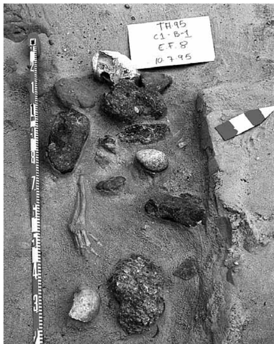
FIGURA 2. EF-8. Piedras depositadas sobre el cadáver.

En Plaza de Asdrúbal/83 presentaron singularidades las siguientes tumbas: