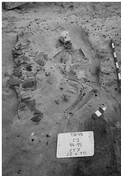
FIGURA 1. Lecho de guijarros y "barrera" de galbos. Osteosarcoma costal (flecha)

a) De todas las tumbas de la ciudad de Cádiz publicadas en los Anuarios Arqueológicos de Andalucía sólo una tumba refiere esta peculiaridad. Se trata de la tumba F/A1/T3 (Plaza de Asdrúbal/85) y la describen como " fosa simple sin cubierta con lecho de piedras y fragmentos cerámicos ", datada en el siglo III-II a.C. (PERDIGONES Y MUÑOZ, 1986, 59). Otro enterramiento en que se refiere también la presencia de un lecho de guijarros es la Tumba-8 (Plaza de Asdrúbal/83), que se describirá más adelante ya que forma parte de este estudio. La rareza de este tipo de preparación del lecho hace pensar que se realizaba en casos muy excepcionales.