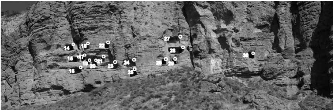
FIG. 1.- El Risco de las Cuevas en Perales de Tajuña (Madrid). Detalle de las cuevas situadas al este.