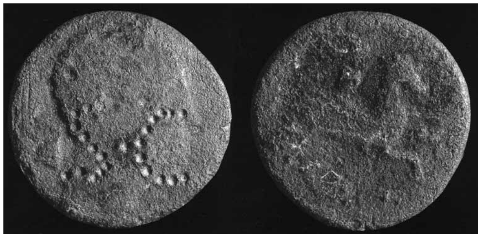
LÁM. VI. Moneda de Cese contramarcada con las siglas S. C. (García Bellido y Ripollet, 1998: 204).

de tres monedas de Claudio (entre los años 41 y 54 d.C.). Dicha cronología sería corroborada por los sondeos estratigráficos llevados a cabo en 1987, con motivo de la construcción de un polígono industrial en una parte del espacio ocupado por esta fundición romana de Fuente Espí (CHOCLÁN, MARTÍNEZ y SÁNCHEZ, 1990).