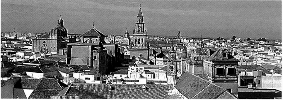
LÁMINA II: Vista del casco histórico.

vado, ya que dejó dibujos y acuarelas detallados de gran parte de las tumbas y sus ajuares. Esta colección de minuciosos apuntes de campo es la única información que queda de muchos enterramientos hoy destruidos.