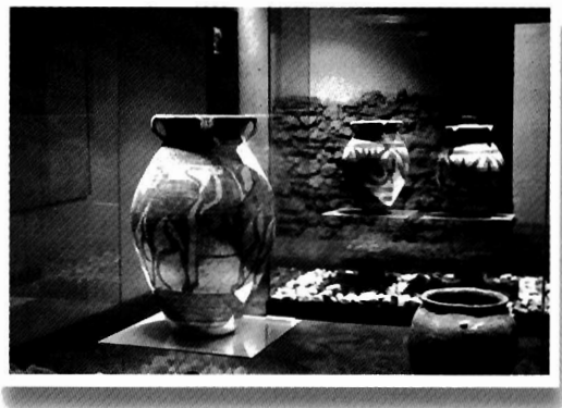
LÁMINA III: Sala tartésica del Museo de la ciudad.

2.- Es obvio que para que entre el objeto patrimonial y la sociedad haya un acercamiento que permita la valoración de aquél por parte de esta es necesario que medie un trabajo técnico que sirva de enlace. Es decir, es necesaria la presencia de los profesionales del Patrimonio, fundamentalmente arqueólogos, historiadores del arte y antropólogos que, entre otras cosas, proporcionen una lectura adecuada de estos elementos. En la producción escrita del equipo de Carmona se repite hasta la saciedad una segunda frase “sólo se conserva aquello que se comunica” que contiene una importantísima reflexión para la práctica patrimonial y que se puede traducir en el axioma: es imposible valorar aquello que no se conoce, lo que no se valora no se conserva, y, en definitiva, lo que no se conoce no se conserva (Lám. III).