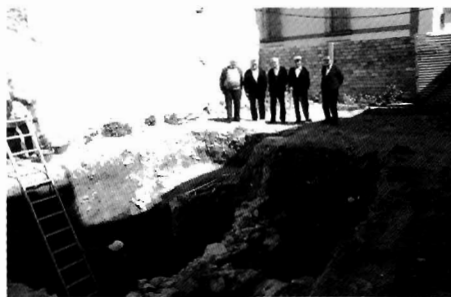
LÁMINA IV: Visita espontánea a las excavaciones.