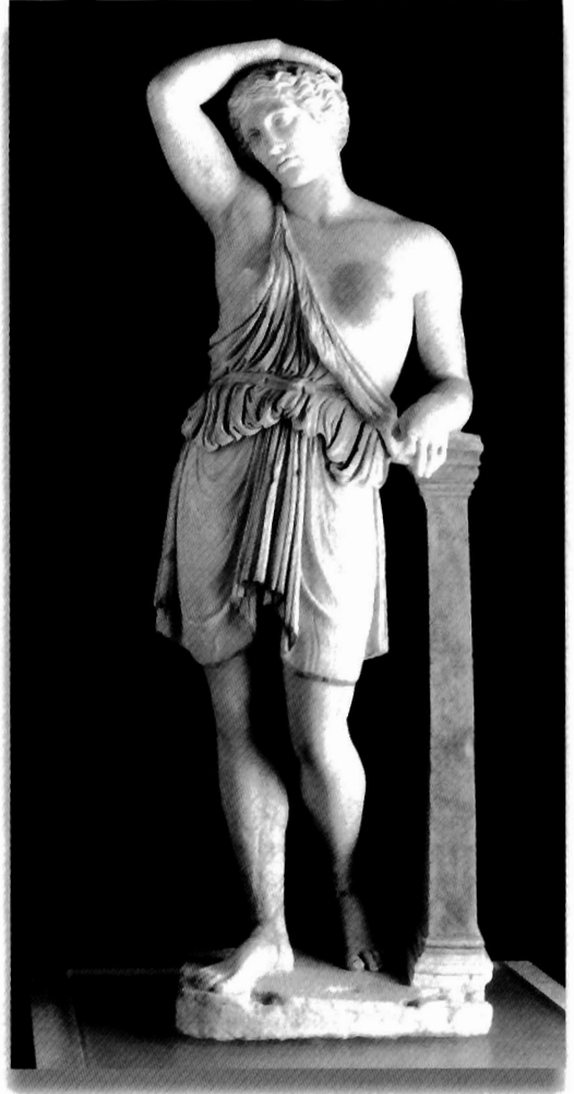
LÁMINA II: Amazona herida (Écija)

sistemas de drenaje de la piscina (de cloaca abovedada con medio cañón a otra de cubierta adintelada de piedra).