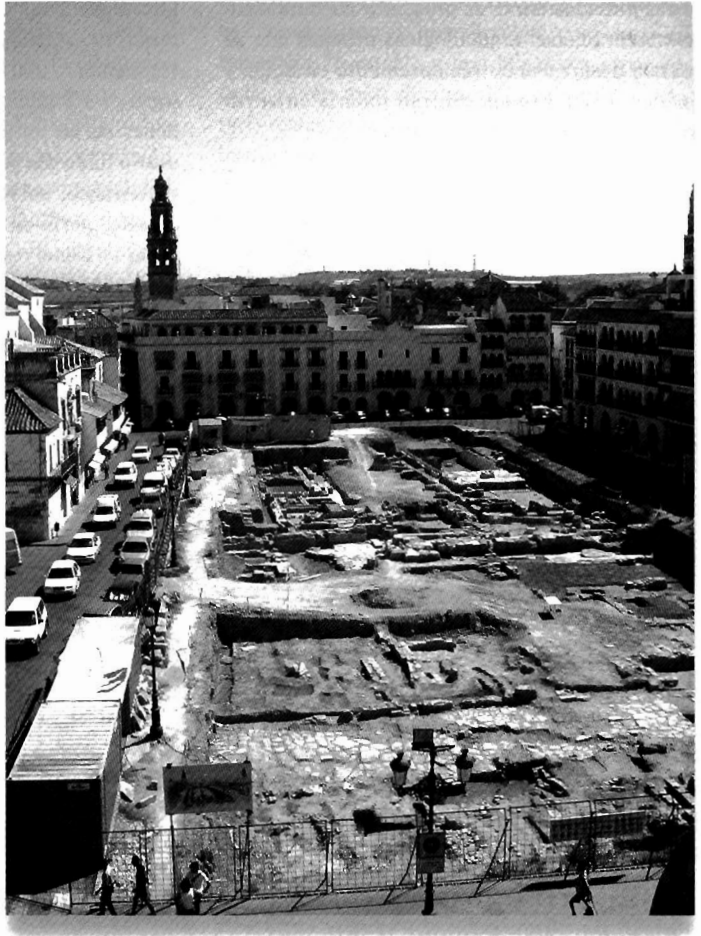
LÁMINA I: Vista panorámica de la plaza de España de Écija en el curso de las excavaciones arqueológicas