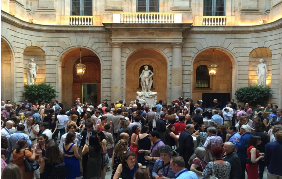
Cóctel y cena de clausura