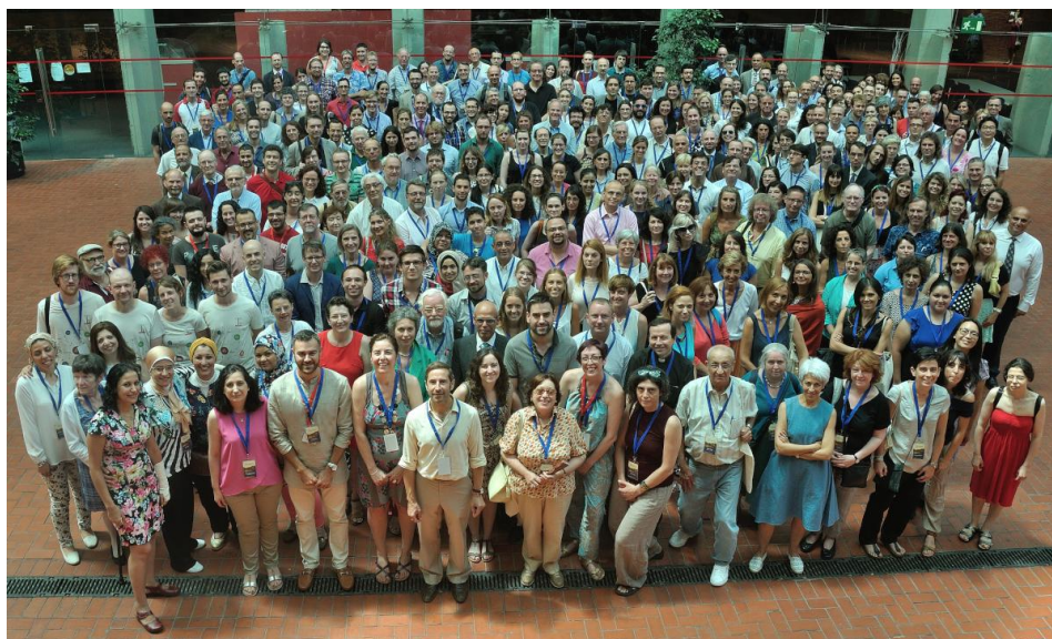
Foto de grupo

Tras la asamblea general, los participantes y asistentes que así lo solicitaron emprendieron el viaje a Tarragona (sábado), y Ampurias / Ullastret (domingo), como parte de las actividades organizadas tras el congreso.