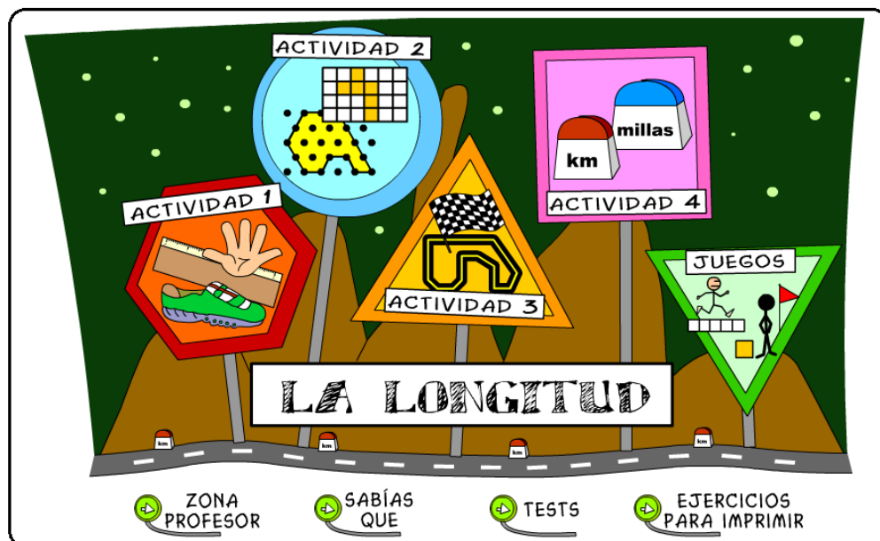
Figura 3: Página de recursos.