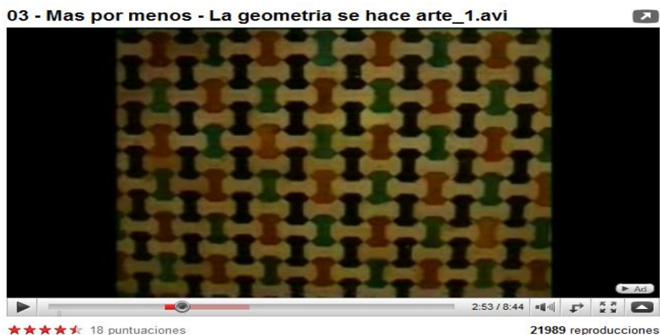
Figura 5: Vídeo sobre los mosaicos nazaríes