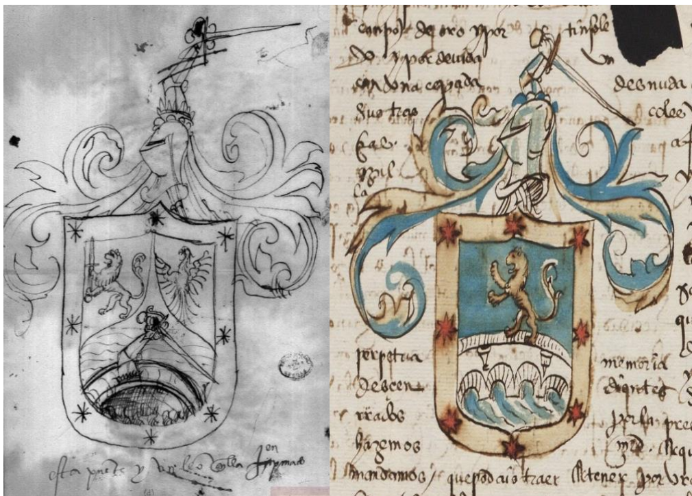
Fig. 2: Propuesta (AGI, MP-Escudos, 25) y armerías concedidas a Blas Pérez (ADA-C238-1-1)

Examinaré a continuación otros dos casos 9 . En la solicitud de Blas Pérez (1537) se adjunta una propuesta dibujada consistente en un mantelado de: 1) león esgrimiendo una espada, 2) águila, y 3) puente con un brazo armado de espada saliente, más una bordura general estrellada. La anotación del perito reza: “esta puente y un león a ella empinado”, apuntando con toda parquedad que el nuevo escudo debía constar de un campo único en el que se dispondrían aquellos muebles cuyo carácter alusivo se explicita en la concesión (1543): “una puente de plata o blanca sobre unas aguas de mar azules y blancas, en memoria de la que vos defendistes de los dichos indios, y sobre ella un león en salto, de oro, en campo azul, y por orla ocho estrellas coloradas en campo de oro” (Figura 2).