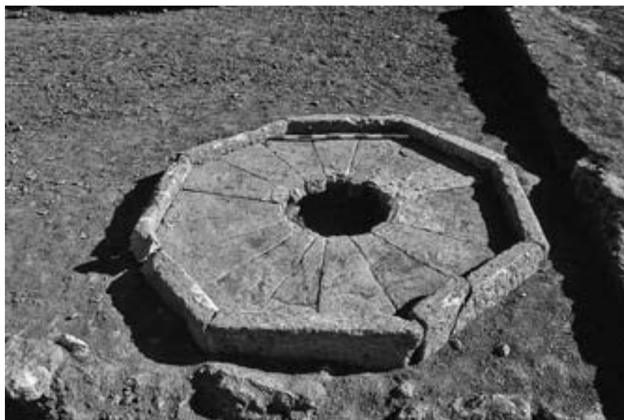
Lám. 5: Pozo de agua con rebosadero octogonal.

No obstante, en el área intervenida nos encontramos con un predominio del aprovisionamiento individual y privado del agua, mediante pozos ejecutados en cada una de las viviendas. Esta práctica tan común, se ve facilitada enormemente dada la riqueza del acuífero subterráneo existente y su superficialidad.