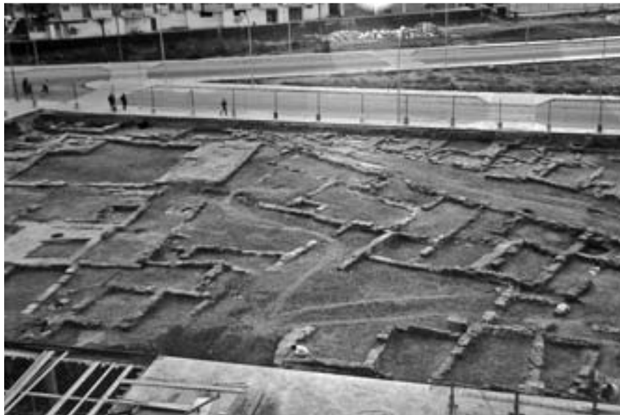
Lám. 1: Vista parcial de la excavación en la manzana 6 del Polígono de Poniente (Edificio Caravelle).

Este método, como todos, tiene sus ventajas e inconvenientes. Adolece de no ser una excavación sistemática. La utilización de medios mecánicos, la superficie de las parcelas y la premura de tiempo, lo hacen prácticamente imposible.