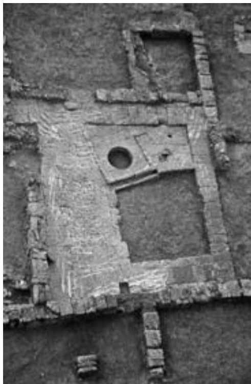
Lám. 4: Patio con pozo de agua, parcialmente pavimentado con losas de caliza.

Independientemente de su tamaño, en él se ubica el pozo de agua de la vivienda, pudiendo ocupar esta una posición central o desplazada hacia uno de los laterales.