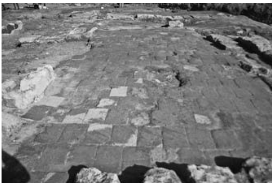
Lám. 6: Salón-alcoba pavimentado mediante baldosas de barro cocido.

En cuanto al revestimiento que presentarían los paramentos, tanto en las estancias, como en las fachadas, casi nada se conserva. Tan solo restos escasos in situ en algunas estancias, amén de fragmentos diseminados como resultado del derrumbe, permiten deducir que este estaría compuesto por una capa de enlucido que, en la mayoría de las ocasiones, se encuentra pintado a la almagra o en colores cremas. En ningún caso se ha podido determinar la existencia de motivos decorativos o alternancias de color.