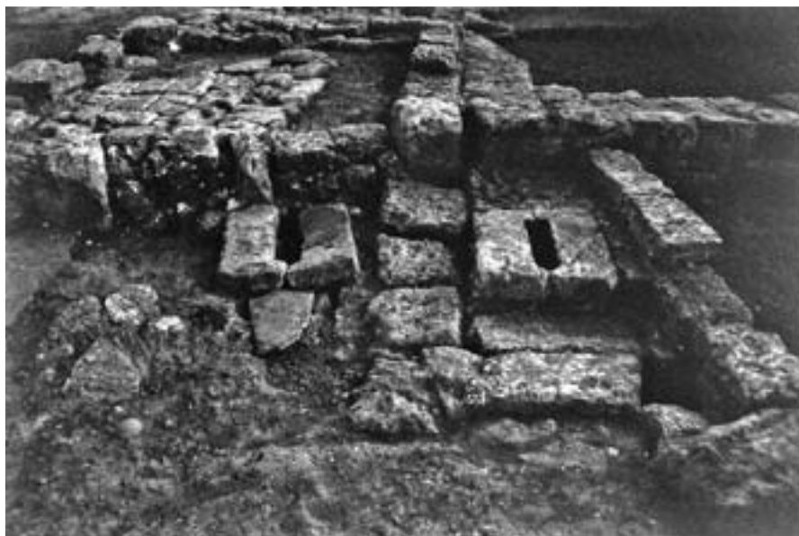
Lám. 3: Letrinas.

Otras son espacios muy reducidos, pavimentados de losas de caliza o baldosas de barro cocido, presentan una hendidura larga y estrecha, abierta en un poyo de losas de caliza, algo elevado respecto al pavimento, evacuando los residuos, a través de un pequeño canal o bajante, bien a un pozo ciego, bien a una atarjea. 13