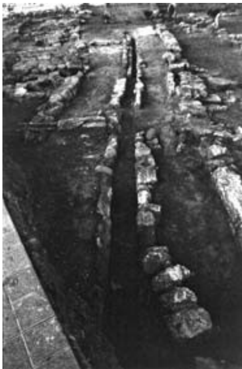
Lám. 2: Vial de arrabal con atarjea central.

De otra parte, se ha podido determinar la existencia de atarjeas para la evacuación de las aguas residuales. Discurren por el eje central de la calle. Son, por regla general, de pequeñas dimensiones, aunque su tamaño viene determinado por la importancia de la vía pública en la que se ubiquen, y su cubierta la componen losas de caliza o lajas de pizarra.