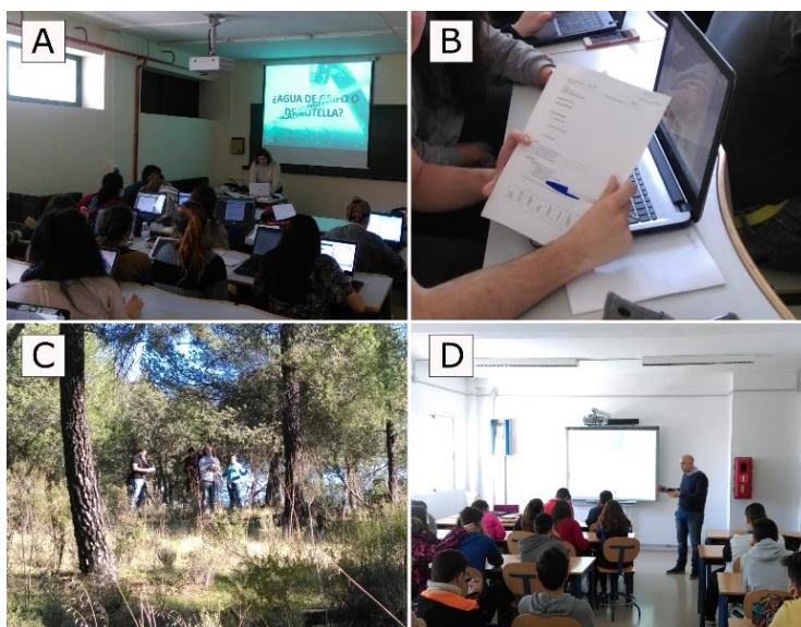
Figura 1: Sesiones expositivas de las píldoras y trabajo del alumnado. A: Sesión expositiva de la asignatura “Fundamentos de Higiene Alimentaria”. B: Detalle de la ficha de evaluación en manos de un alumno de la asignatura. C: Alumnos de “Ordenación de Montes (I)” trabajando en el monte “Terrenos Comunes de Adamuz”. D: Discusión de una píldora tras su visualización en la asignatura “Ordenación de Montes (I)”.

Las sesiones expositivas resultaron prácticas y dinámicas, con un alto grado de seguimiento por parte de los alumnos (Figura 1). Dicha observación se apoya en los comentarios y la evaluación de competencias registrados en las fichas de autoevaluación entregadas a los alumnos. En otras ocasiones se ha constatado que la aplicación didáctica de herramientas basadas en las TIC's mejora el seguimiento de las sesiones por parte del alumnado (Lucarelli, 2000). La posibilidad de realizar las píldoras informativas desde sus dispositivos móviles permitió acercar al estudiante a nuevos usos de sus teléfonos y tables; ya que estos, se han convertido en artefactos omnipresentes en la vida diaria de las personas y el explorar y explotar estos medios como potenciales recursos didácticos da lugar a nuevos conceptos o estilos de enseñanza como el “ Mobile Learning ” o Aprendizaje Móvil (Brazuelo y Gallego, 2014)