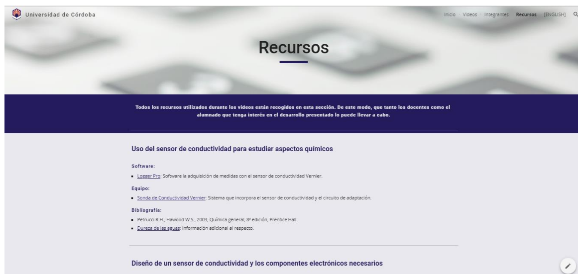
IMAGEN 6. Página web con los recursos utilizados en el proyecto.