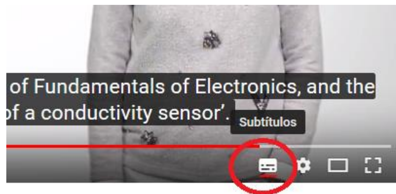
IMAGEN 2. Material empleado para la realización de la medida de conductividad

Estos vídeos se encuentran publicados en YouTube. Están grabados en castellano, y subtítulos en inglés, al cual se accede a través del icono situado en la parte inferior derecha de los vídeos (ver Imagen 2).