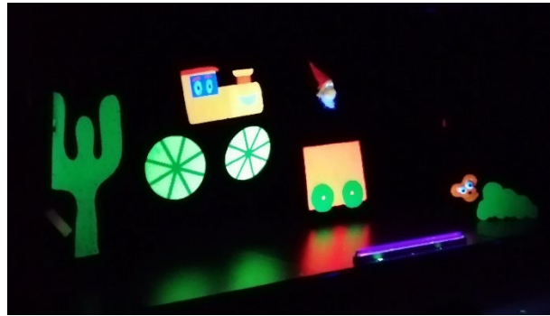
Figuras 8 y 9. Presentación de los cuentos y representación.