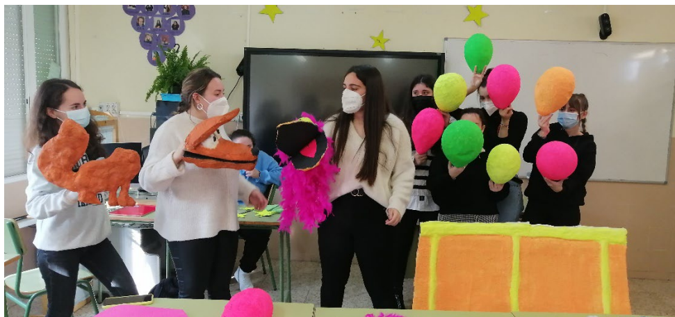
Figura 5. Ensayo en el aula .

El escenario (Figuras 6 y 7) primero se cubre completamente de telas negras y se colocan las luces de neón delante (enfocadas hacia el escenario) y a los lados (sujetas por trípodes); el alumnado vestido de negro tiene que tener en cuenta que no se pueden poner decorados detrás, ni moverse delante de un personaje porque se perfilaría su silueta y se perdería la magia.