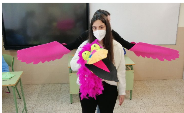
Figuras 2 y 3. Creación de marionetas pequeñas y grandes.

Se construyen en partes separadas la cabeza, los brazos... (en la representación cada parte es manejada por una persona) porque ayuda a mantener la magia y el movimiento en el escenario, por ejemplo, a un personaje se le puede escapar un brazo o colocarse en un lugar que no corresponde.