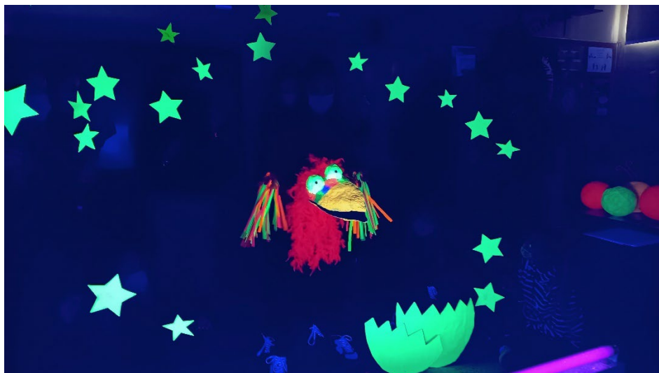
Figura 1. Teatro de luz negra.