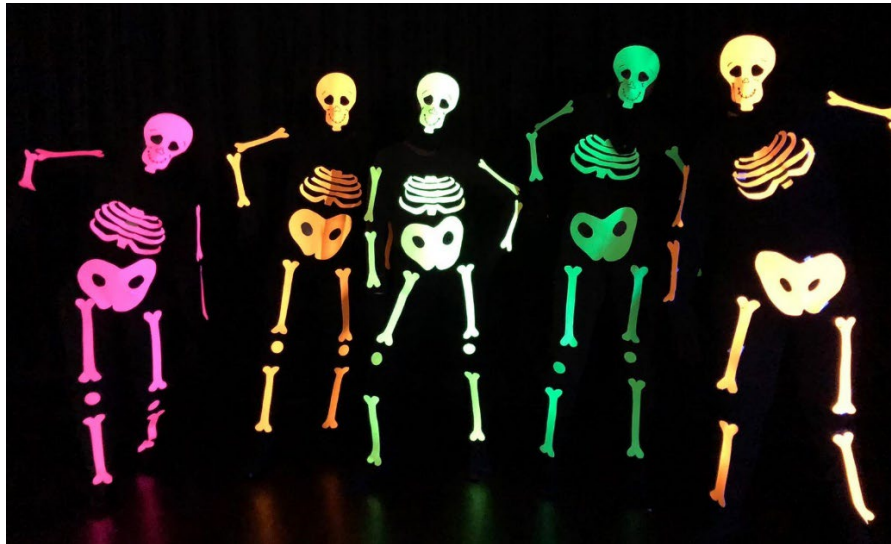
Figura 4. Representación de Halloween .

También se pueden construir los personajes sobre los propios alumnos y alumnas: sobre su indumentaria negra se colocan ropas, cartulinas y complementos blancos o pintados con témperas fluorescentes. Por ejemplo, unos esqueletos de cartulina pegados sobre las personas para la representación de Halloween del IES Batalla de Clavijo (Figura 4).