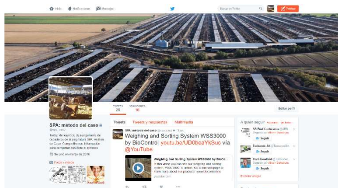
Figura 2. Cuenta de Twitter utilizada para compartir información con los alumnos.

De cara a completar la búsqueda de información de los alumnos se creó una cuenta de Twitter (Figura 2) en la que el profesorado compartió periódicamente datos relacionados con el caso (un total de 25 tweets).