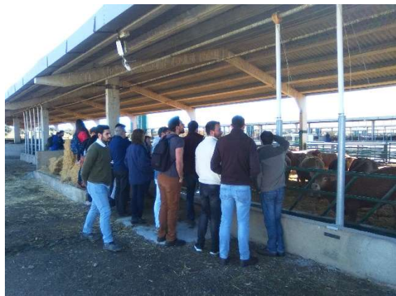
Figura1. Visita de los estudiantes al cebadero

Una vez presentado el caso en el aula, se realizó una visita al cebadero de terneros (Figura 1) para que los estudiantes pudieran observar y tomar datos in situ de las instalaciones a rediseñar. Además, los alumnos pudieron observar la interacción de los animales con las citadas instalaciones, aspecto de vital importancia para el correcto funcionamiento de las soluciones de reingeniería y difícil de transmitir en el aula. Por otro lado, los estudiantes tuvieron la oportunidad de entrevistar a los trabajadores del cebadero para recoger, de primera mano, sus impresiones respecto al funcionamiento actual de las instalaciones y, en algunos casos, sus propuestas de mejora.