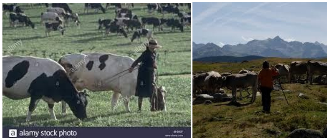
Image montrant des paysannes de la Galice rurale d'Espagne dans l'élevage de bétail et l'autre image présente les femmes à la reconquête de la terre Pyrénées catalanes,