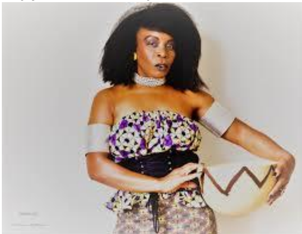
Image présentant la femme de Loango habillée de manière tradi-moderne