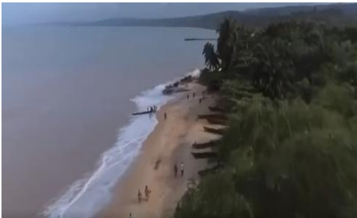
Image montrant la biodiversité de la Baie de Loango