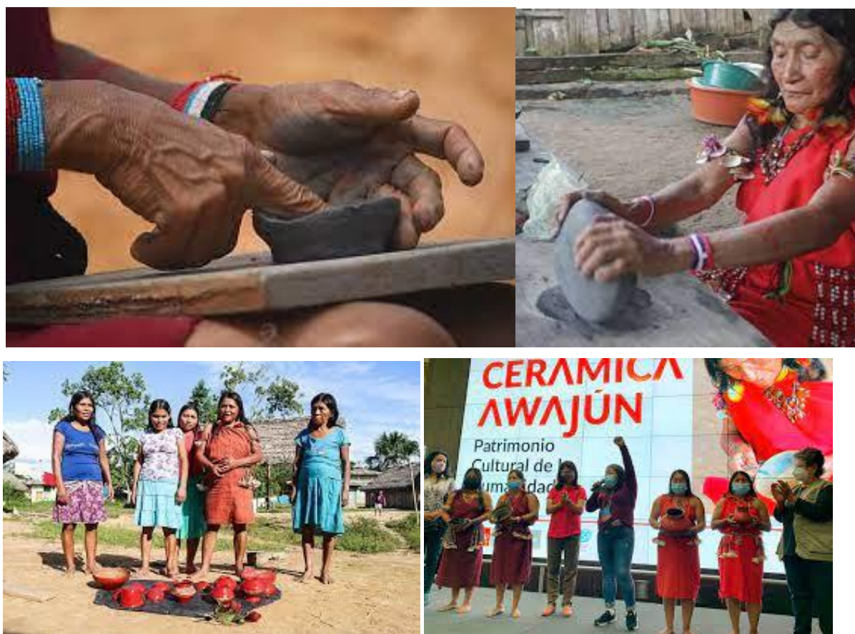
Image montrant le processus de fabrication de la poterie de : la collecte de la matière première, du modelage, de la cuisson, de l'ornementation, de la finition jusqu'à la vente.