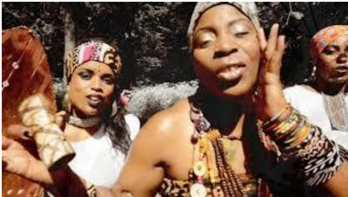
Image montrant les jeunes filles de Loango habillées de manière traditionnelle