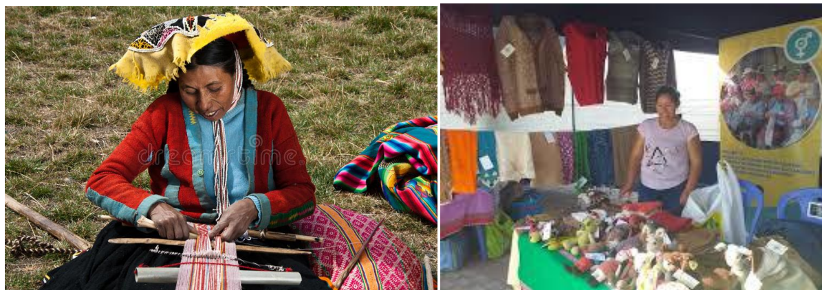
Image montrant une femme rurales Puno du Pérou développant des produits artisanaux et l'autre vendant