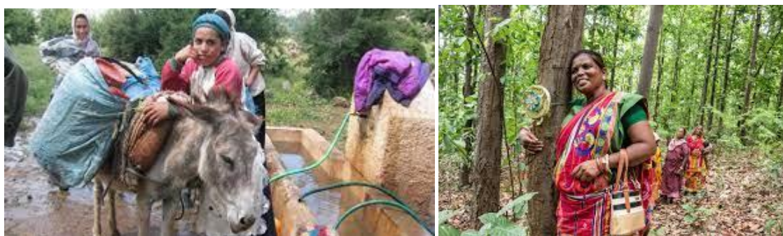
Image présentant des femmes rurales indiennes participant officiellement aux démarches de gestion des forêts et eaux