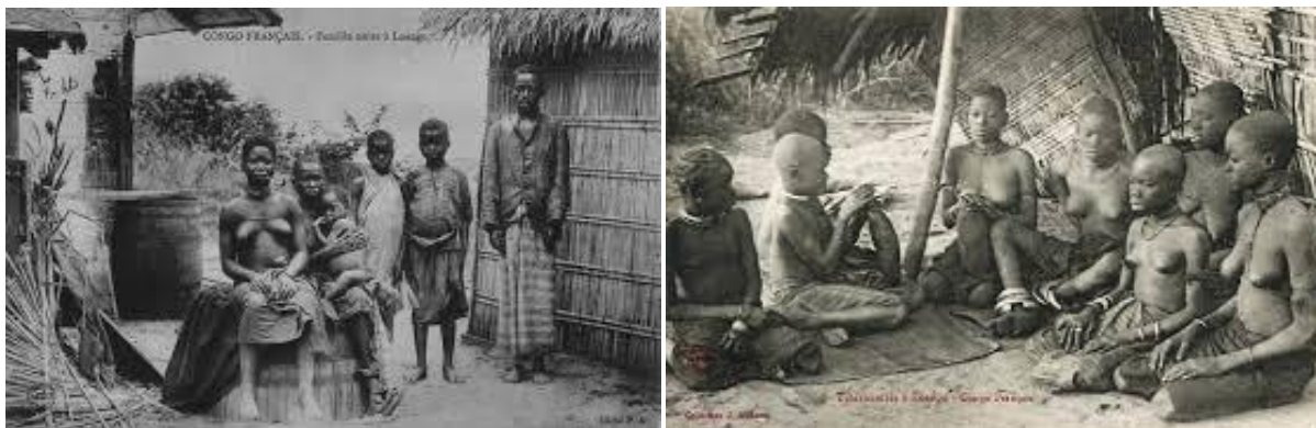
Image présentant une famille de Loango montrant l'harmonie, la cohésion sociale