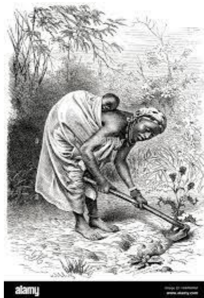
Image présentant une femme mère accompagnée de son petit et faisant l'agriculture pour subvenir aux besoins de sa famille