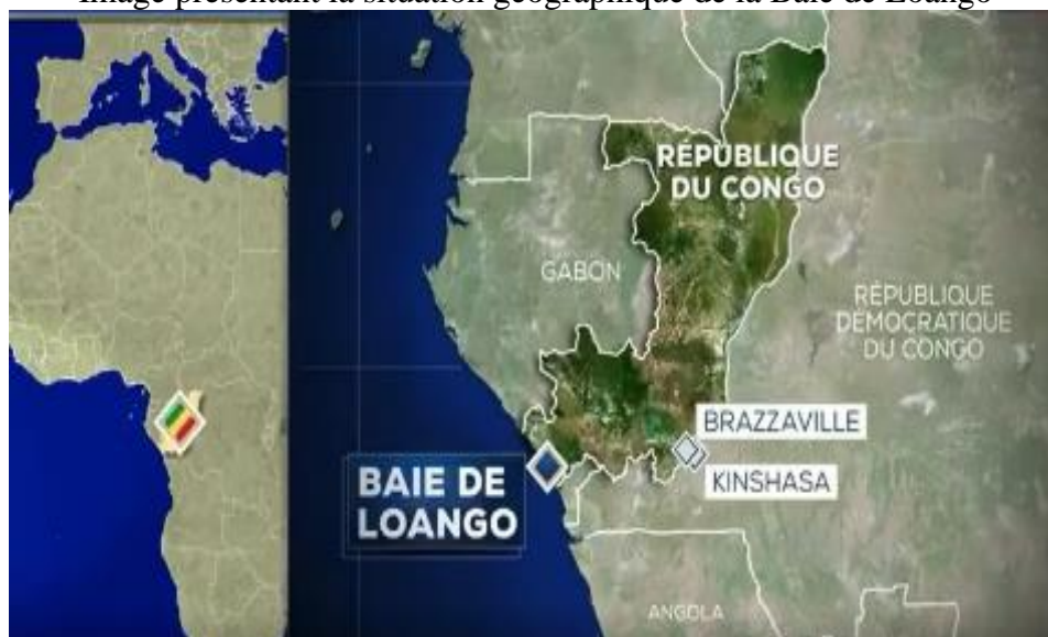
Image présentant la situation géographique de la Baie de Loango