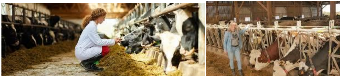
Image montrant des jeunes femmes ayant choisi la filière agricole et élevage