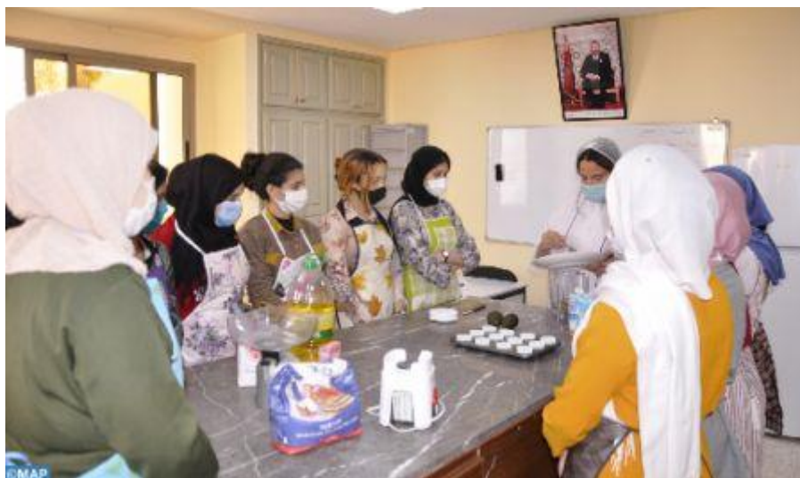
Image montrant les jeunes filles et femmes rurales formées aux métiers de la couture, la gastronomie, la pâtisserie, la bureautique et l'enseignement préscolaire