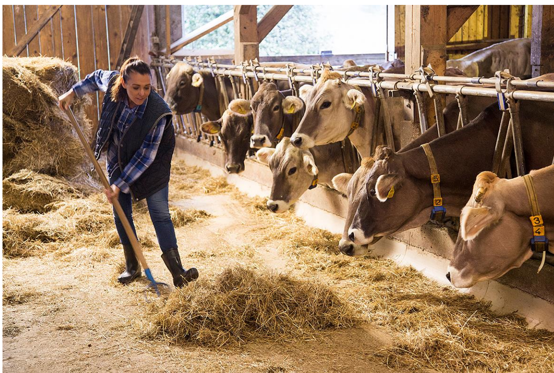
Image d'une jeune fille française en milieu rural saisissant l'opportunité d'élevage