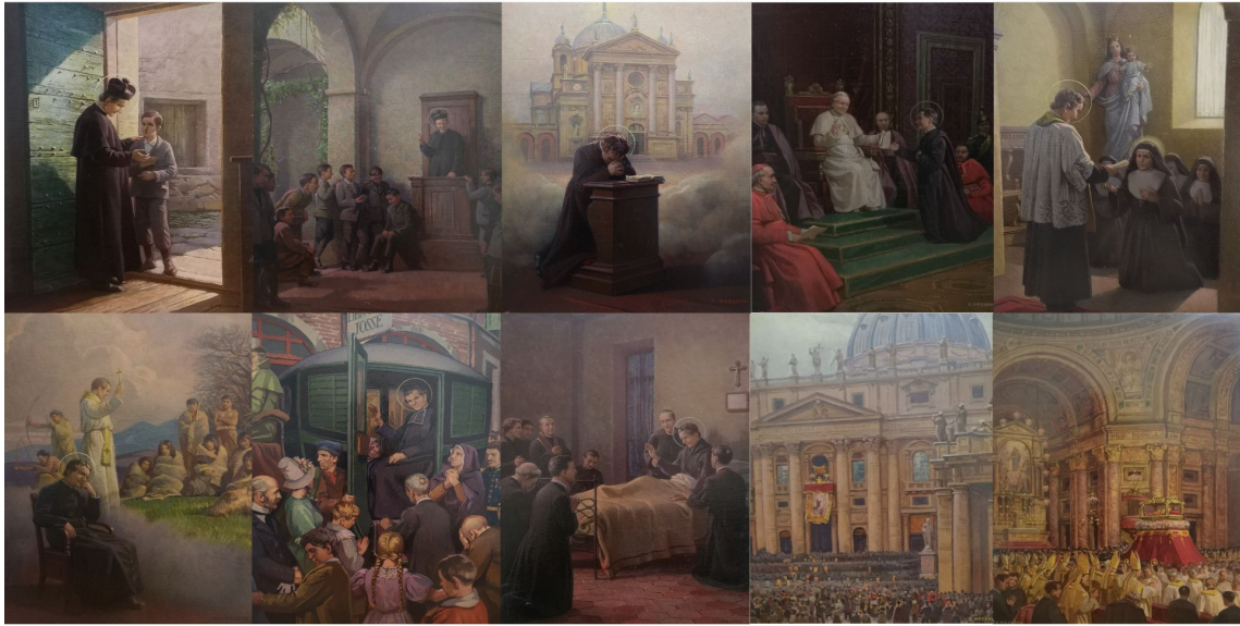
Fig 3. A) 21. Il primo fiore. Domenico Savio, ai Becchi, si presenta a don Bosco / 14. Domenico Savio, il primo fiore degli oratori, si presenta, ai Becchi, a Don Bosco , óleo sobre tabla, 37 x 27.5 cm., 1929. B) 22. Il sermoncino della sera. Don Bosco dalla piccola tribuna dà la buona notte ai ricoverati , óleo sobre tabla, 37 x 27.5 cm., 1929. C) 23. Don Bosco, ha in sogno la visione del futuro Santuario / Don Bosco ha la visione del futuro Santuario di Maria Ausiliatrice , óleo sobre tabla, 37 x 27.5 cm., 1929. D) 24. La sanzione di Roma. Don Bosco inginocchiato dinanzi a Pio IX / Pio IX approva le regole della Pia Società Salesiana presentategli da Don Bosco , óleo sobre tabla, 37 x 27.5 cm., 1929. E) 25. La seconda famiglia salesiana: le Figlie di Maria Ausiliatrice. Don Bosco consegna la Regola a Madre Mazzarello / Le figlie di Maria Ausiliatrice: Don Bosco consegna la Regola a Suor Maria Mazzarello, prima Superiore fma , óleo sobre tabla, 37 x 27.5 cm., 1929. F) 26. Oltre Oceano. Don Bosco sogna i feroci patàgoni che depongono le armi dinanzi ai nuovi missionari / Don Bosco sogna i selvaggi della Patagonia ammansirsi dinanzi ai nuovi missionari , óleo sobre tabla, 37 x 27.5 cm., 1929. G) 27. Don Bosco visita Francia , óleo sobre tabla, 36.8 x 27.9 cm., 1929. Obra no publicada. H) 28. La santa morte / L'ultima benedizione e la Santa morte del Beato Don Bosco , óleo sobre tabla, 37 x 27.5 cm., 1929. I) 29. Beatificación de don Bosco en el Vaticano , óleo sobre tabla, 36.9 x 27.8 cm., 1929. Obra no publicada. J) 30. Solemne procesión por la beatificación de don Bosco, fiestas en el interior de la iglesia de María Auxiliadora de Valdocco en Turín , óleo sobre tabla, 36.9 x 27.9 cm., 1929. Obra no publicada.