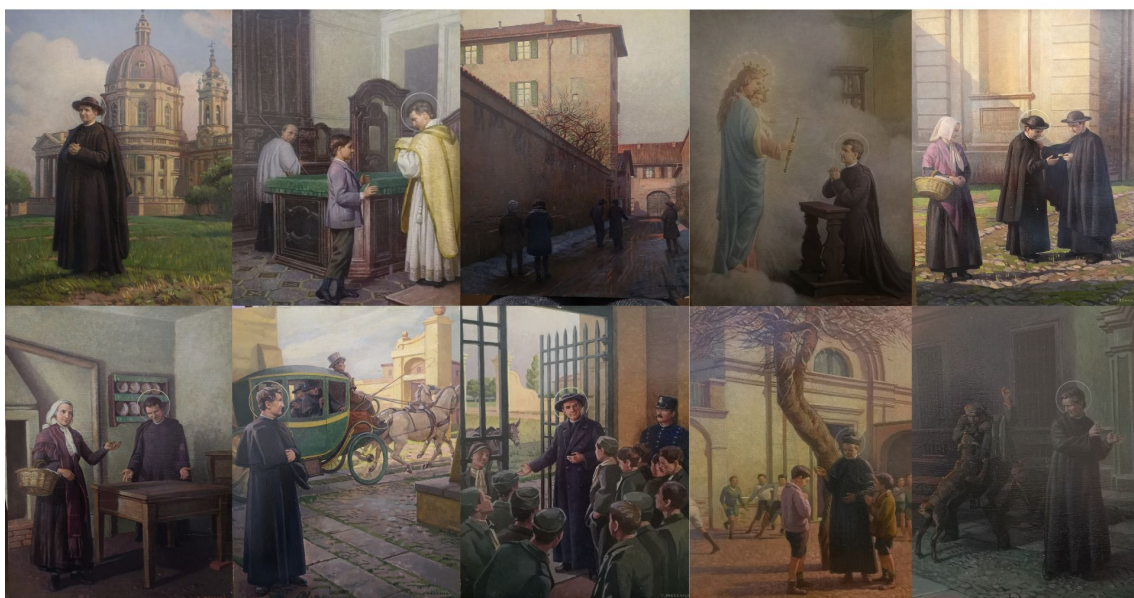
Fig. 2. A) 11. Il campo dell'apostolato. Don Bosco giungendo a Torino vede da Superga la città che lo attende / Don Bosco, giungendo a Torino, contempla da Superga la città che lo attende, óleo sobre tabla, 36.9 x 27.4 cm., 1929. B) 12. L'inizio della grande opera. Don Bosco parla con Bartolomeo Garelli / Don Bosco incontra Bartolomeo Garelli, che sarà il suo primo allievo, óleo sobre tabla, 36.9 x 27.5 cm., 1929. C) 13. La prima cappella al Rifugio. Il vicolo stretto con la vista della finestra della cappella. Gruppi di giovinetti che s'avviano , óleo sobre tabla, 37 x 27.5 cm., 1929. D) 14. Maria Ausiliatrice sorride fra le nubi a don Bosco assorto in preghiera , óleo sobre tabla, 36.9 x 27.5 cm., 1929. E) 15. La Provvidenza. Il Teol. Vola regala l'orologio a Don Bosco / La Provvidenza... il Teologo Vola regala a Don Bosco l'orologio, óleo sobre tabla, 37 x 27.5 cm., 1929. F) 16. La sede stabile. Mamma Margherita a don Bosco mettono a posto le poche masserizie , óleo sobre tabla, 37 x 27.5 cm., 1929. G) 17. Don Bosco se libera del manicomio, óleo sobre tabla, 37 x 28 cm., 1929. Obra no publicada. H) 18. Don Bosco lleva a pasear a varios jóvenes de "la Generala", óleo sobre tabla, 36.8 x 28 cm., 1929. Obra no publicada. I) 19. Un nuovo sistema di educazione. Don Bosco in mezzo ai suoi fanciulli durante la ricreazione / I fanciulli non devono temere i loro educatori ma amarli. Fu il principio di Don Bosco. Ecco durante la ricreazione dei ricoverati, óleo sobre tabla, 37 x 27.5 cm., 1929. J) 20. Il "Grigio". Il Grigio assalta i due ribaldi che hanno già avvolto don Bosco in un mantello / "Grigio" il cane misterioso e fedele, appare più volte in difesa di Don Bosco, óleo sobre tabla, 36.9 x 27.6 cm., 1929.

Giovanni Borel. El 12 de abril de 1846 don Bosco adaptó el espacio del cobertizo como capilla e inauguró en una sede estable el Oratorio di San Francesco di Sales . La escena representada ilustra el momento en el que alquila las habitaciones para sí mismo y para su madre, Margherita Occhiena (fig. 2. F. 16). También se incluye el episodio en el que dos sacerdotes, con el propósito de trasladarlo a un manicomio, intentan engañarlo para que suba a un carruaje cerrado; sin embargo, don Bosco, al percatarse de sus intenciones, les invita a subir primero y, una vez dentro, ordenó al cochero que los trasladase a ellos al manicomio (fig. 2. G. 17). Asimismo, se representa su visita a las cárceles de Turín, como la Generala , experiencia que en 1841 lo llevó a concebir la estructura del Oratorio como respuesta a la delincuencia juvenil y a la falta de educación entre los jóvenes más vulnerables de la ciudad (fig. 2. H. 18); don Bosco acompañado por dos jóvenes durante el recreo en el patio frente a la iglesia de San Francisco de Sales en Valdocco (fig. 2. I. 19); y, por último, este conjunto cierra con la presencia del Grigio , un perro que, con apariencia similar a la de un gran lobo gris y, desconocido para don Bosco, surgía inesperadamente en situaciones de peligro, interviniendo en su favor y protegiéndolo (fig. 2. J. 20).