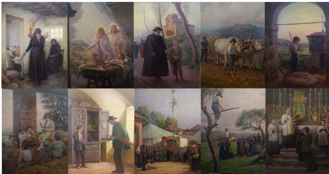
Fig. 1. Fig. 1. A) 1. Eccoti senza padre! I A due anni Giovannino Bosco rimane orfano del Padre , óleo sobre tabla, 36.8 x 27.4 cm., 1929. B) 2. Il sogno... I Il sogno del piccolo Giovanni: un giorno egli trasformerà i lupi in agnelli... , óleo sobre tabla, 37 x 27.7 cm., 1929. C) 3. L'incontro con don Calosso , óleo sobre tabla, 36.9 x 27.5 cm., 1929. D) 4. Alla cascina Moglia I Maltrattato dal fratellastro, Giovanni si colloca come garzone di campagna , óleo sobre tabla, 36.9 x 27.5 cm., 1929. E) 5. L'Angelus I Al suono dell'Ave, il giovinetto, dai suoi pesanti lavori leva al cielo l'Angelus... , óleo sobre tabla, 36.9 x 27.4 cm., 1929. F) 6. Il germe degli Oratori. Giovannino su un fenile spiega il catechismo ad alcuni coetani I Nelle ore di riposo, Giovanni insegna il catechismo ai compagni , óleo sobre tabla, 37 x 27.4 cm., 1929. G) 7. "Ho più caro il Paradiso che tutte le ricchezze e i denari del mondo..." , óleo sobre tabla, 37 x 27.5 cm., 1929. H) 8. L'Albero della Cuccagna! – Abile e santa industria I Per tenere i compagni lontani dal male, Giovanni si trasforma in abile saltimbanco e li diverte , óleo sobre tabla, 37 x 27.4 cm., 1929. I) 9. Il Piccolo saltimbanco – Giovanni cammina sulla corda tra i contadinelli attoniti , óleo sobre tabla, 37 x 27.5 cm., 1929. J) 10. La vestizione chiericale. Giovannino, finalmente, riceve l'abito ecclesiastico dinanzi all'altare della chiesa parrocchiale di Castelnuovo d'Asti I Verso la sua via. Giovanni riceve l'abito ecclesiastico , óleo sobre tabla, 37 x 27.5 cm., 1929.

Las siguientes diez composiciones representan escenas de la vida de don Bosco en el período comprendido entre 1841 y 1852. En este conjunto se incluyen momentos significativos, como su llegada a Turín, cuando, en noviembre de 1841, observa la ciudad desde lo alto de la colina de Superga (fig. 2. A. 11); el encuentro con el joven Bartolomeo Garelli durante la festividad de la Inmaculada Concepción en 1841, episodio considerado fundamental en el inicio de su labor apostólica en Turín (fig. 2. B. 12); su desempeño como director espiritual del Ospedaletto di Santa Filomena , momento donde adapta dos habitaciones del Refugio de la Marquesa Barolo y establece una primera capilla dedicada a San Francisco de Sales para los jóvenes (fig. 2. C. 13); don Bosco en oración ante la Virgen María Auxilio de los Cristianos (fig. 2. D. 14); el encuentro con el teólogo don Giovanni Vola en Valdocco, momento justo después de la convalecencia de don Bosco en I Becchi, en la casa familiar. En este cruce, ocurrido en noviembre de 1846, don Bosco expresó su preocupación por la falta de una sede estable para los jóvenes y, ante la carencia de recursos económicos, don Vola le obsequia su reloj (fig. 2. E. 15). Las siguientes escenas representan acontecimientos clave en la consolidación de su obra, como la negociación con Pancrazio Soave y el alquiler, a nombre de don Bosco, de la tettoia o cobertizo de la casa del señor Pinardi, gracias a la intervención del teólogo don